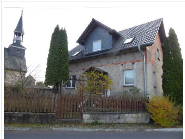
Blick von der Ortsstraße (Ursprungsbau)

Amtsgericht Rudolstadt Marktstraße 54, 07407 Rudolstadt Aktenzeichen K 111/25 Objektart Einfamilienhaus Anschrift Horba 31, 07426 Königsee