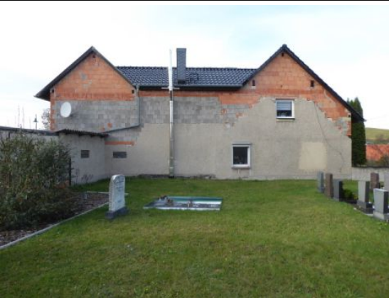
Blick vom Friedhof