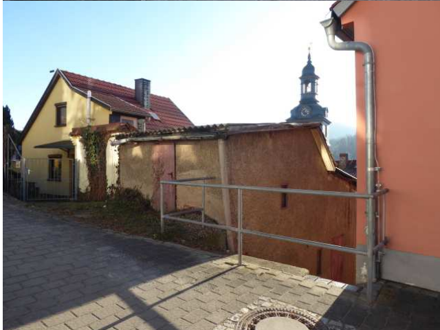
Blick von der „Esplanade“ Foto 2