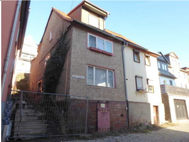
Blick vom Oberen Sonnenberg Süd - West - Ansicht Foto 1