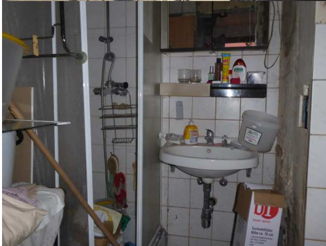
Sanitärbereich im Vorderhaus Erdgeschoß Foto 3