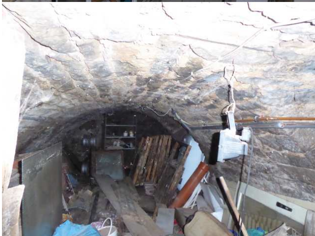
Teilansicht des Gewölbekellers Foto 4