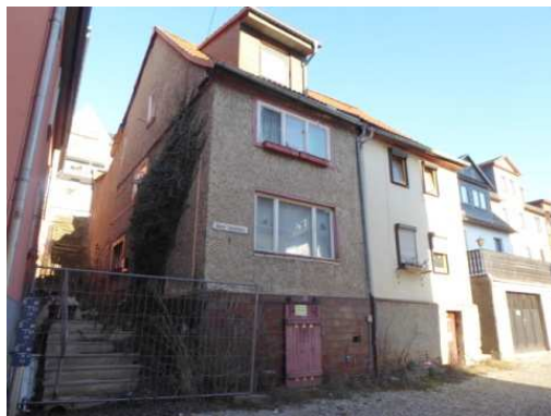
Blick vom Oberen Sonnenberg