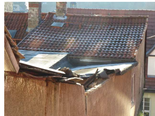
Blick von der Esplanade