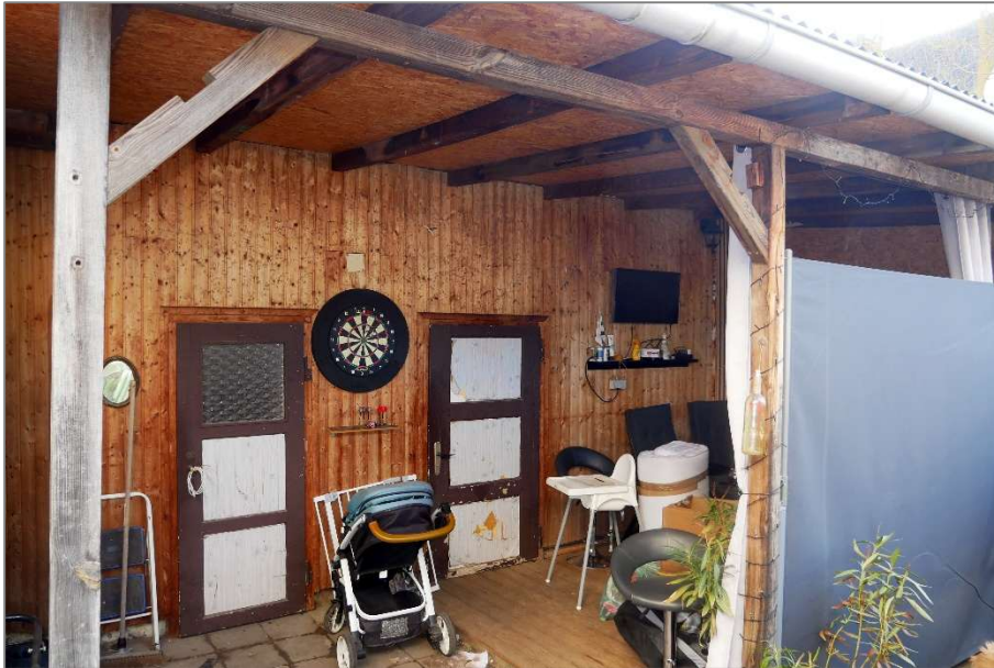
Nebengebäude und überdachter Freisitz - Ostansicht