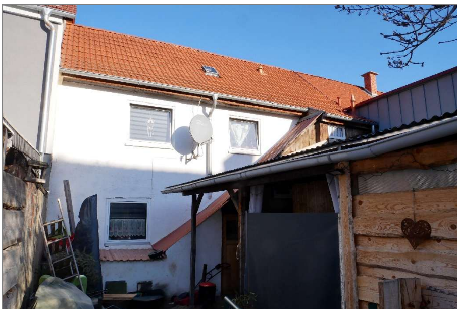
Wohnhaus - Südansicht (Hofansicht)