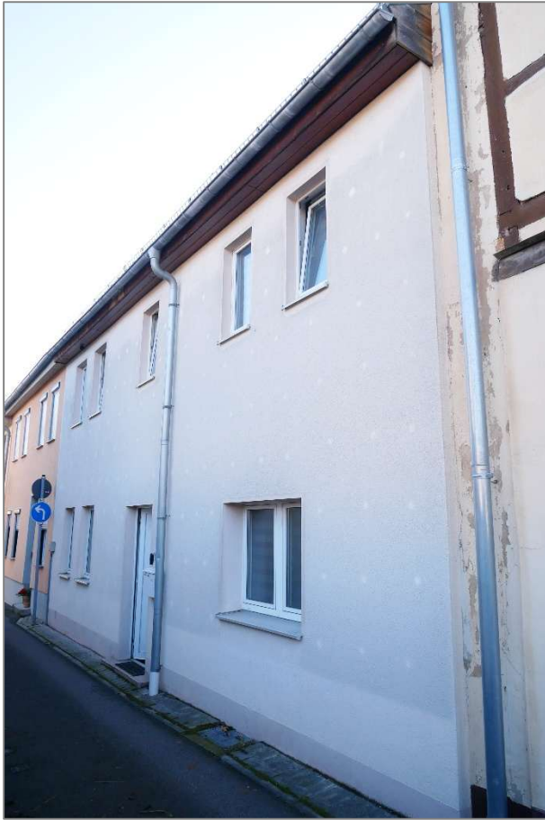
Wohnhaus - Nordwestansicht (Straßenansicht)