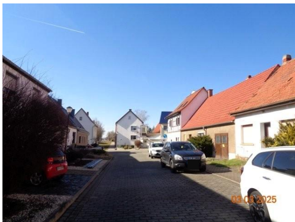
Bild 21: Bebauung im unmittelbaren Umfeld – Blick in westliche Richtung