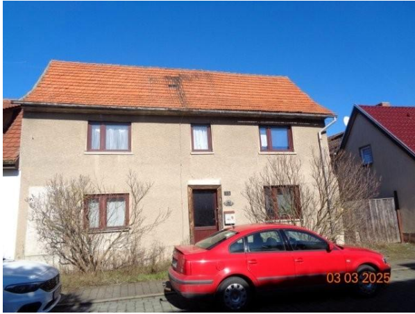
Bild 9: südseitige Straßenansicht des Wohngebäudes Backhausstraße 35 in 99631 Günstedt