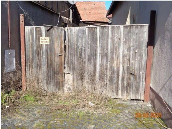
Bild 19: Torzufahrt zum Grundstück Backhausstraße 35 (Flurstück 502)