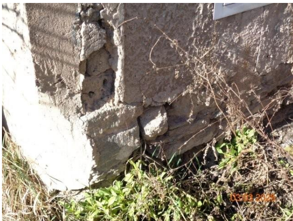
Bild 15: Putz- und Mauerwerksschäden im Sockelbereich der Gebäudesüdostecke