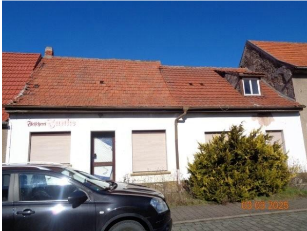
Bild 1: südseitige Straßenansicht des Gebäudes Backhausstraße 34 in 99631 Günstedt