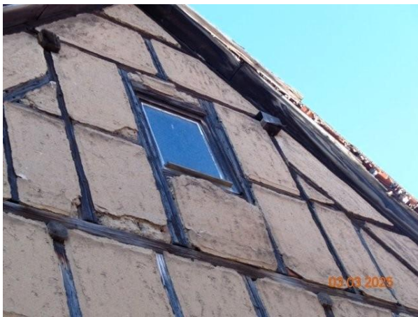
Bild 11: Ausfachungen im östlichen Bereich des Dachgeschossgiebels außer Lot stehend