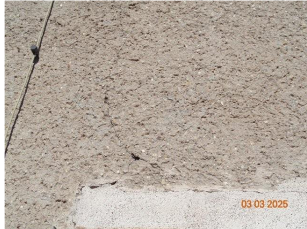
Bild 14: partielle Rissbildung Fassade / Umfassungswände südseitig