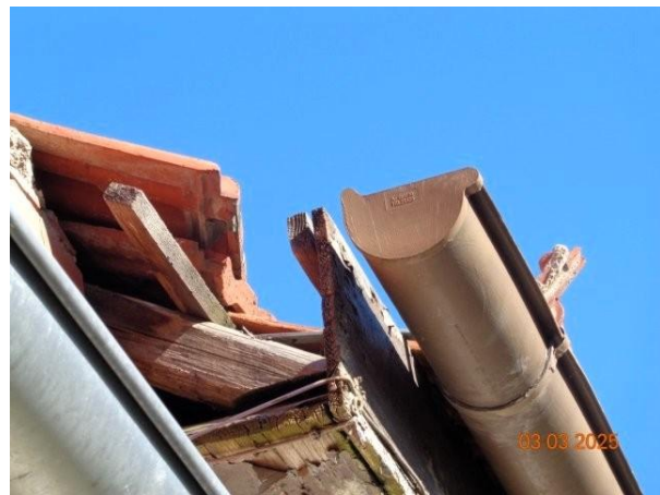
Bild 4: Dachziegel im südwestlichen Eckbereich des Gebäudes Backhausstraße 34 zum Teil fehlend sowie Dachkanten schadhafte