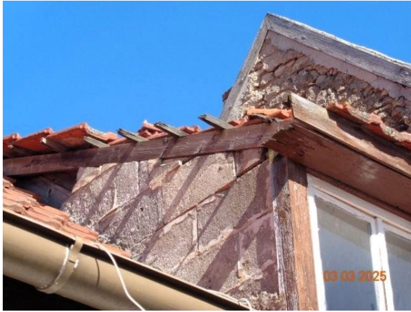
Bild 5: Dachziegel auf Dachgaube des Gebäudes Backhausstraße 34 zum Teil fehlend