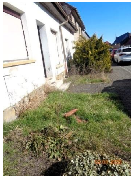
Bild 8: Vorgartenbereich vor dem Gebäude Backhausstraße 34 – zum öffentlichen Straßenraum gehörend