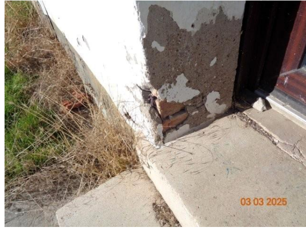
Bild 6: Putzschäden und Farbabblätterungen im Bereich der Eingangstür Gebäude Backhausstraße 34