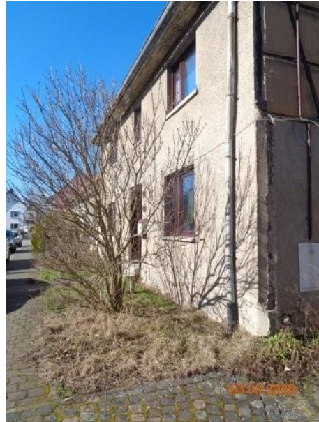
Bild 18: Vorgartenbereich vor dem Wohngebäude Backhausstraße 35 – zum öffentlichen Straßenraum gehörend