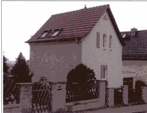
Blick von der Wartenbergstraße