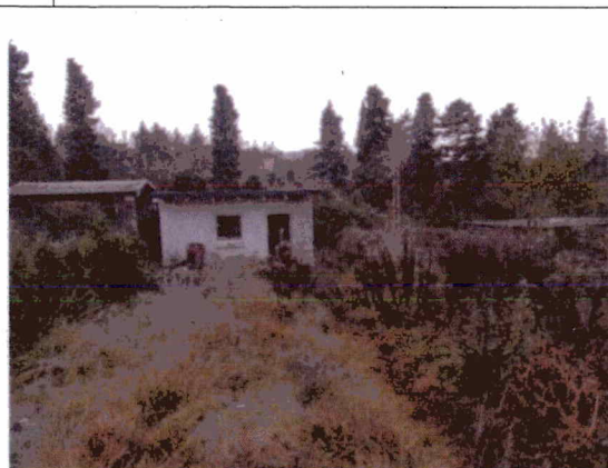
Blick nach Süden zur Gartenhütte