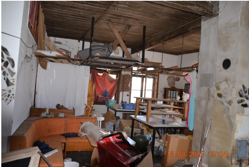
Vorderhaus: Vermüllter Zustand der Räume im Erdgeschoss