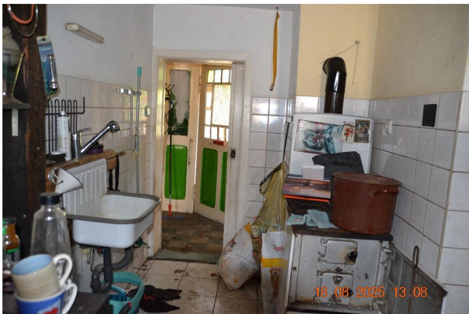
Hinterhaus: Küche im Erdgeschoss