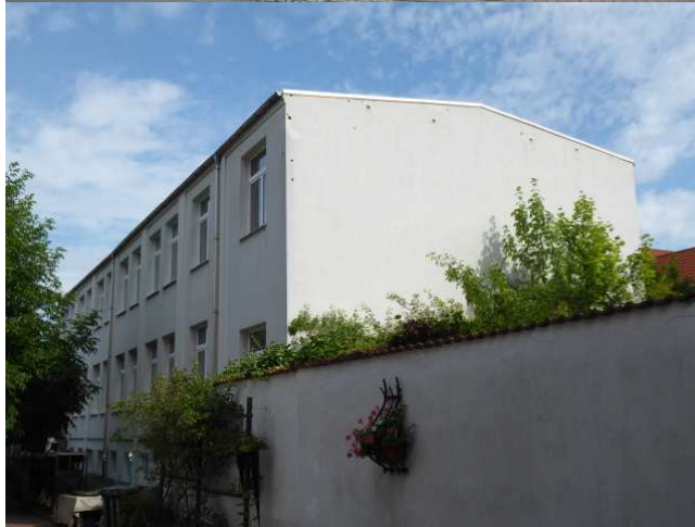
Süd – West – Ansicht Foto 2