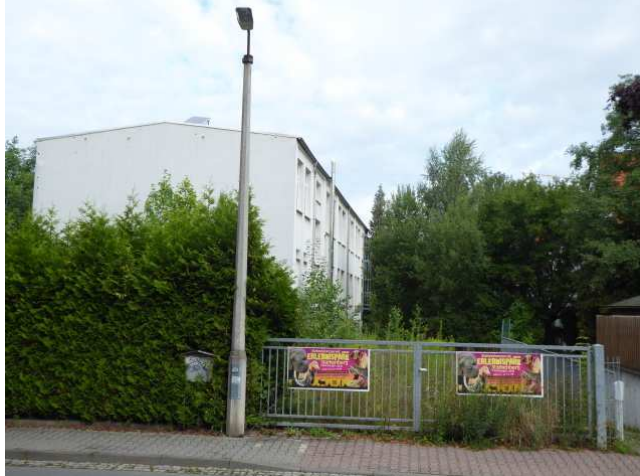
Blick und Zufahrt von der Sommeritzer Straße Süd – Ost – Ansicht Foto 1