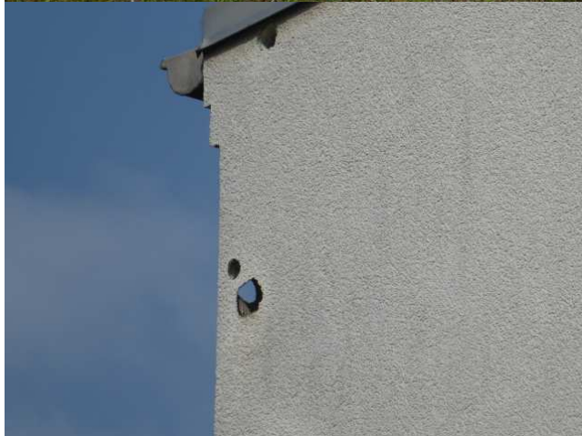
Detail Südgiebel Foto 4