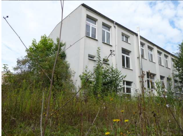
Süd - Ost - Ansicht Foto 3