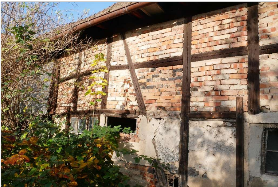
Scheune - Südansicht