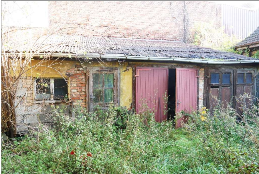
Garage / Schuppen - Westansicht