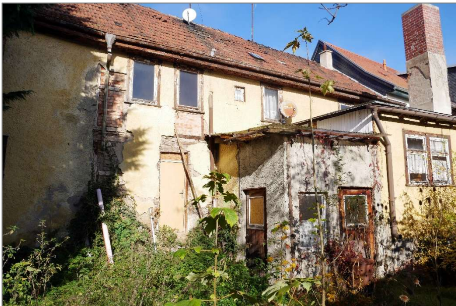
Wohnhaus - Südansicht (Hofansicht)