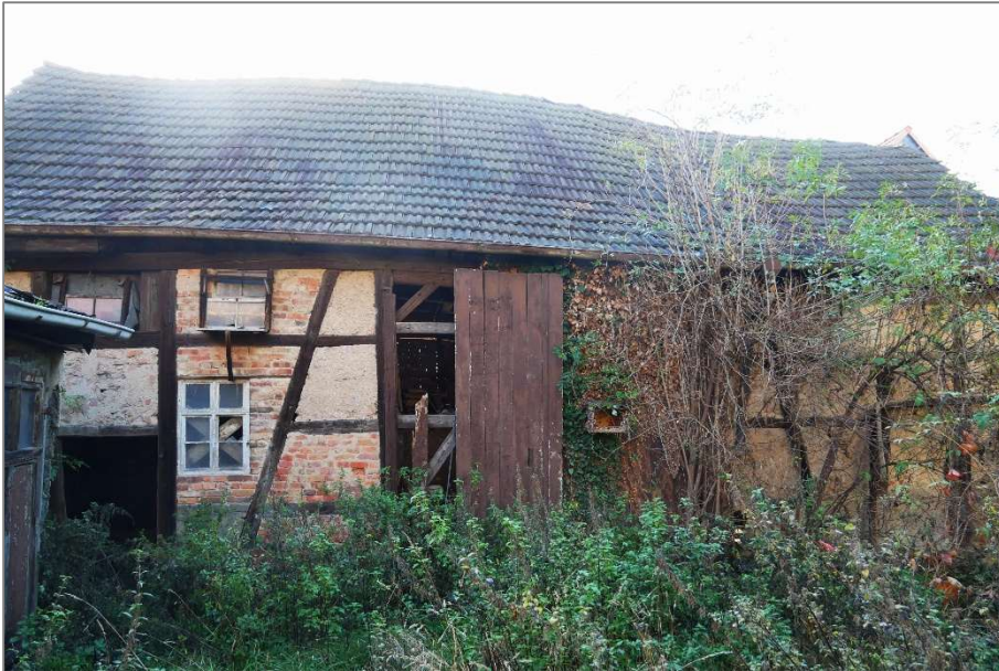
Scheune - Nordansicht