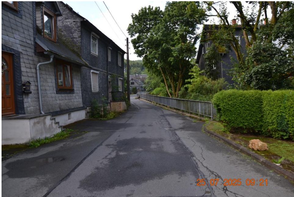
Schmale Anliegerstraße vor dem Gebäude