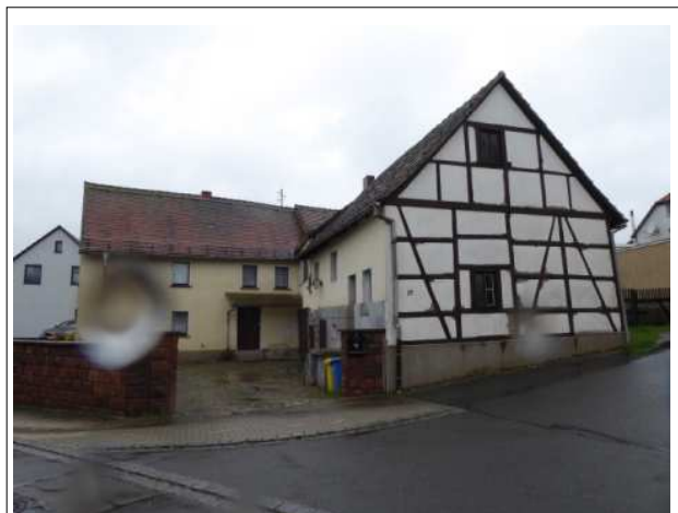
Blick von der Ortsstraße (Flurstück 3/11)

Amtsgericht Gera Rudolf - Diener - Straße 1, 07545 Gera Aktenzeichen K 12/25 Objektart Sonstiges (Bauernhof) Anschrift Mühlsdorf 29, 07586 Kraftsdorf