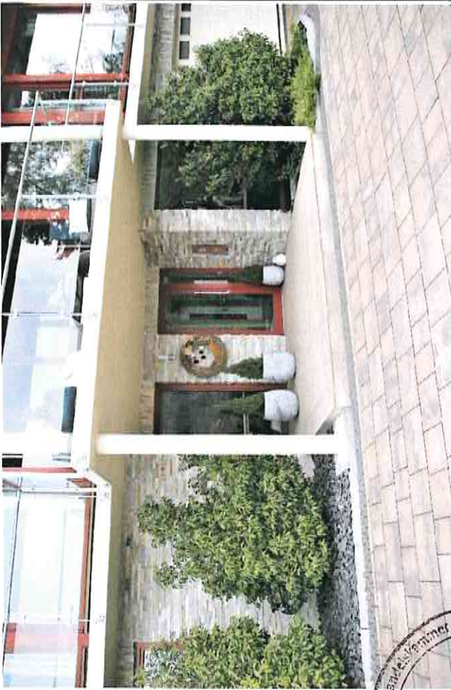
Wohnhaus Südseite Haupteingang Außenanlagen südwestlicher Bereich