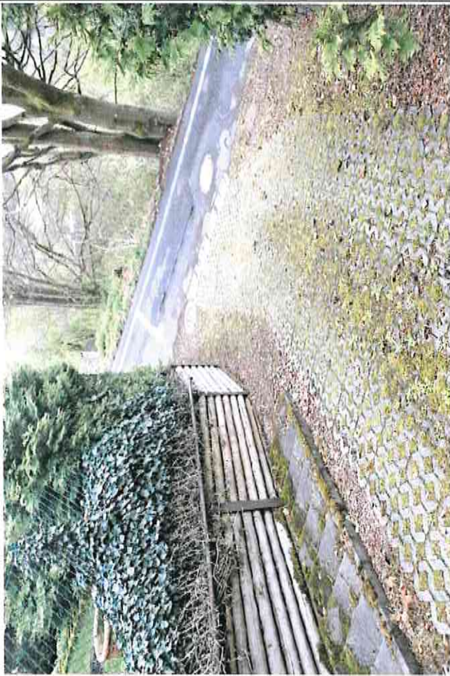
Weg Westseite Blick in Südostrichtung (Ringberg, Ringberghotel)