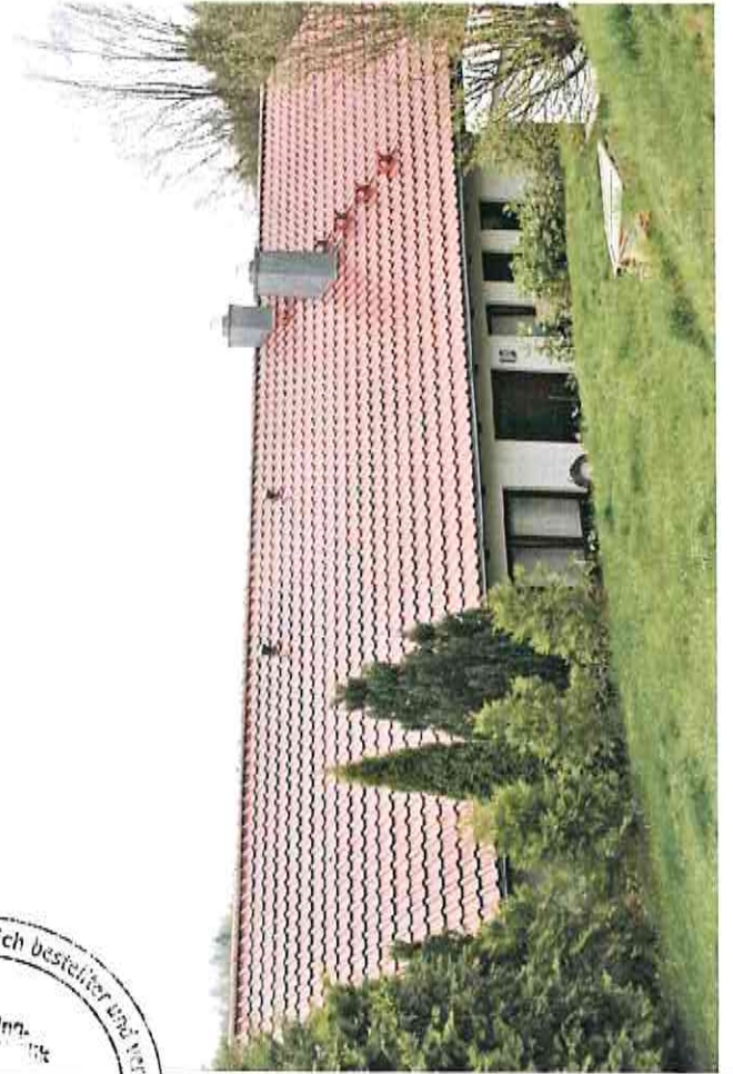
Wohnhaus Nordansicht Außenanlagen