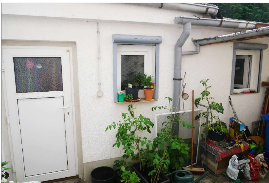
Wohnhaus - hofseitiger Anbau im EG