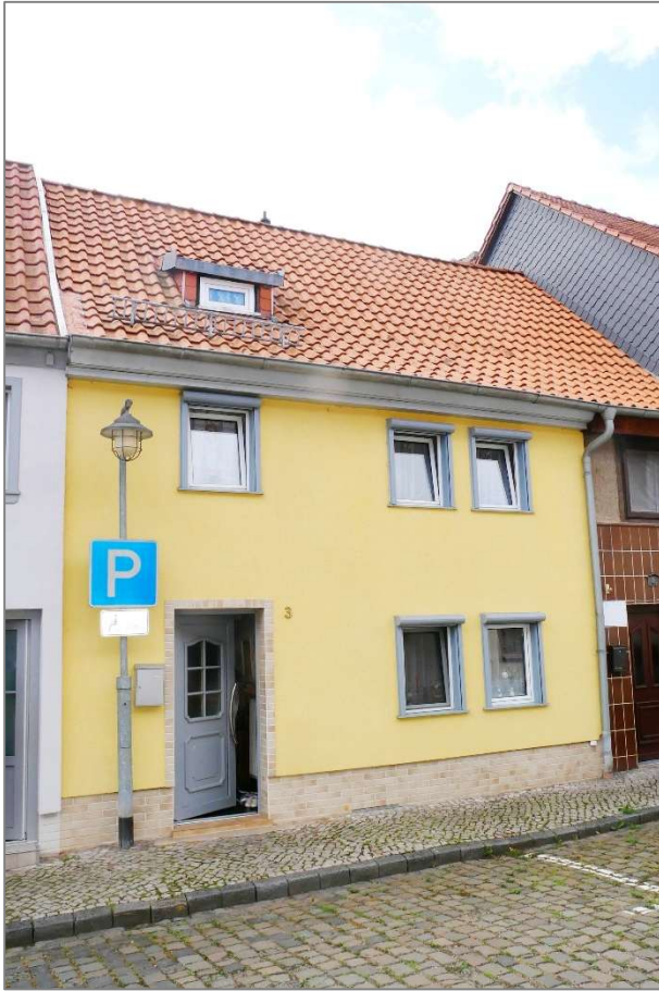
Wohnhaus - Straßenansicht