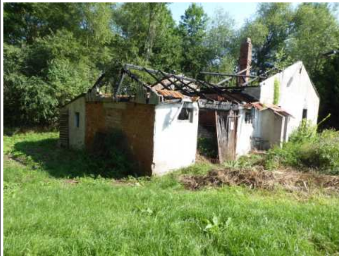
aufstehendes ruinöses Gebäude (K 3/24)