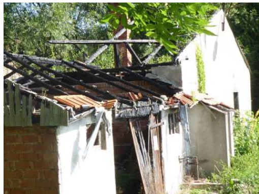
K 3/24 (Brandruine)