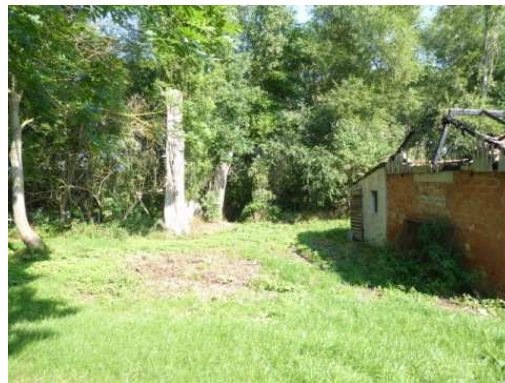
K 15/22 (Grund und Boden)