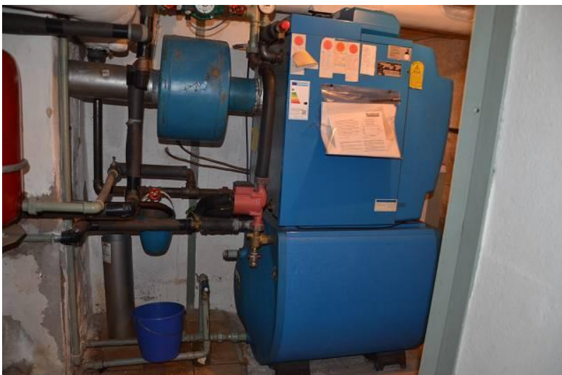
Foto 15 HEIZUNG