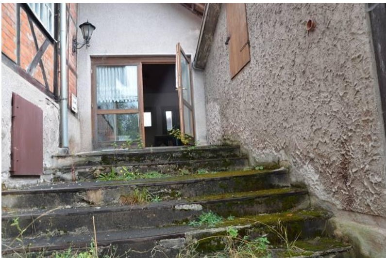
Foto 29 EINGANG LAGERBEREICH