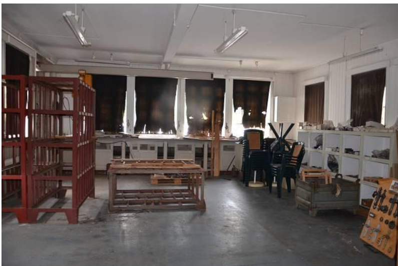
Foto 24 LAGERRAUM IM OBERGESCHOSS