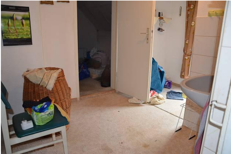
Foto 7 RAUM IM DACHGESCHOSS