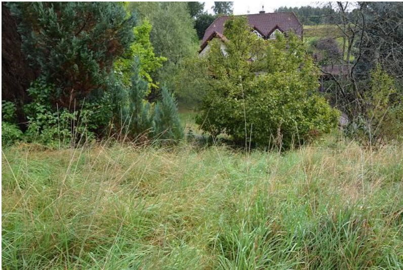
Foto 31 AUßENBEREICH HINTERRAUM