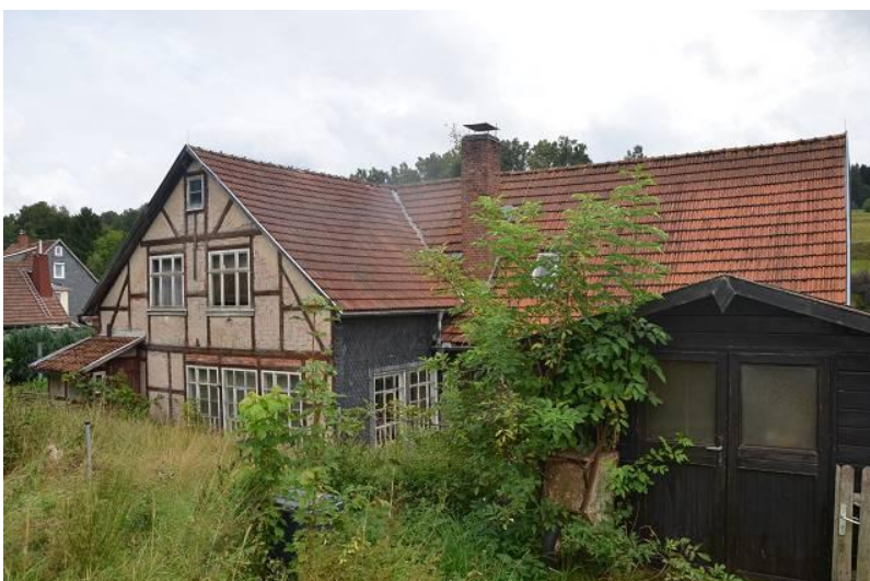
Foto 21 NEBENGEBAUDE ANSICHT VOM HINTERRAUM