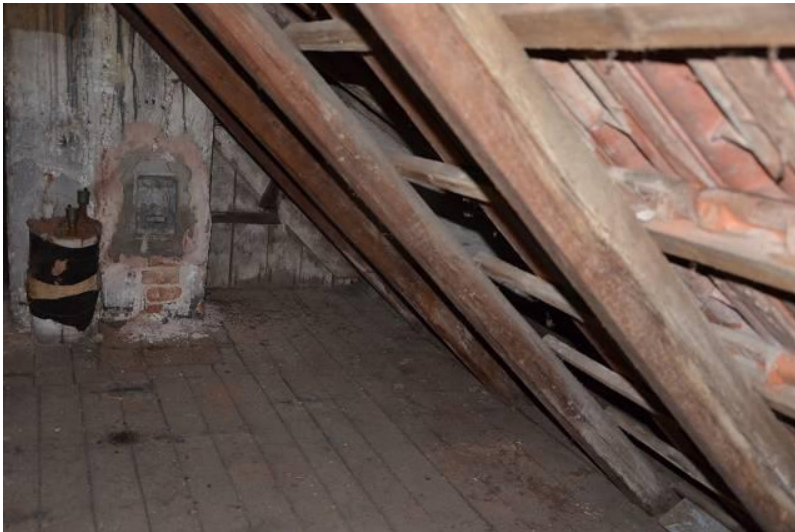
Foto 4 DACHRAUM