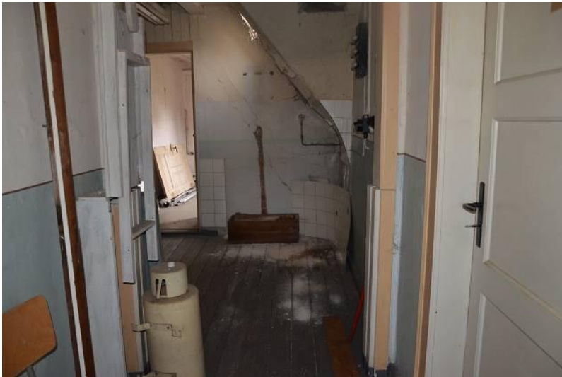
Foto 22 BEREICH IM DACHGESCHOSS