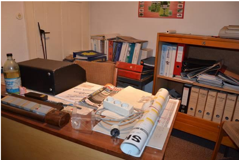
Foto 25 EHEMALIGER BÜROBEREICH