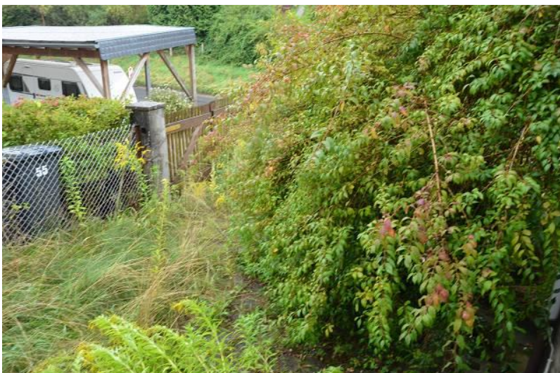
Foto 33 VORDERRAUM MIT EINGANG