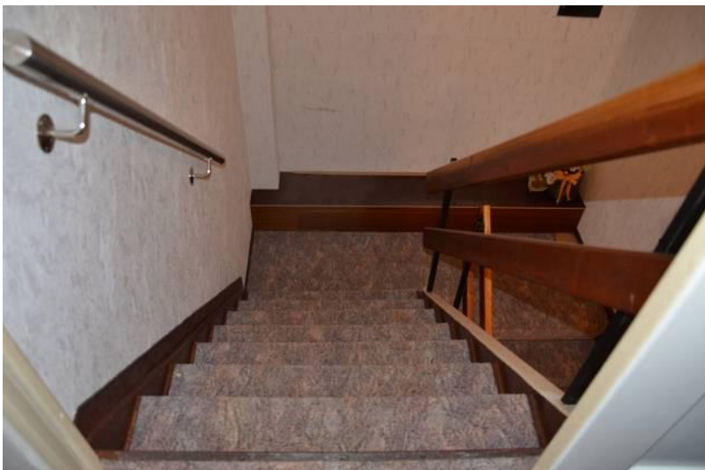
Foto 5 TREPPENRAUM