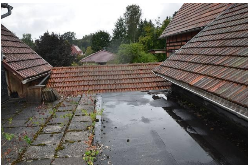
Foto 9 DACHTERRASSE