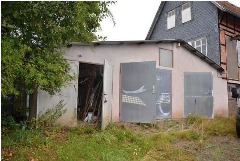
Foto 19 GARAGENBEREICH