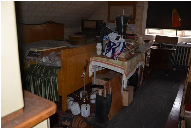
Foto 23 RAUM IM DACHGESCHOSS