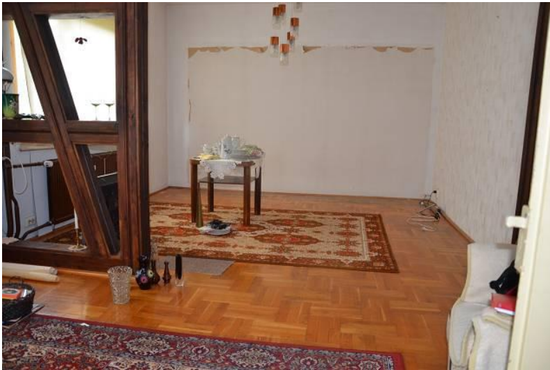
Foto 10 WOHNZIMMER IM ERDGESCHOSS