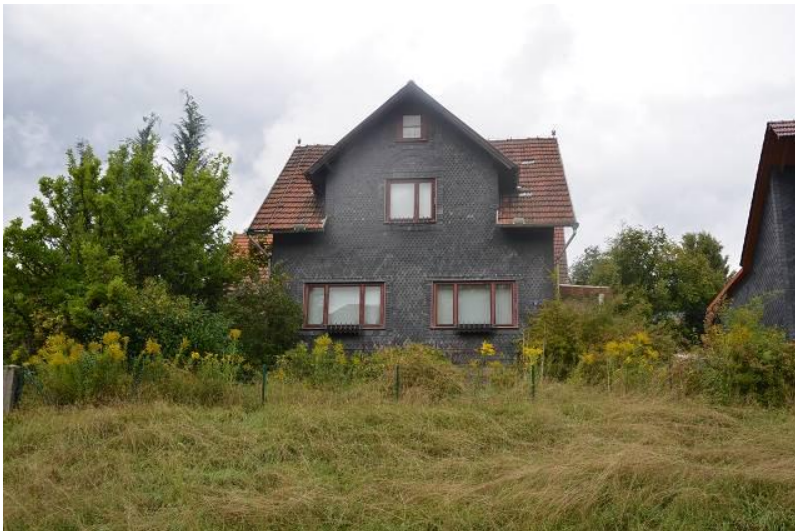
Foto 2 WOHNHAUS AUF DEM FLURSTÜCK 1090/ 621