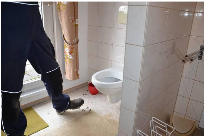
Foto 8 WC MIT AUSGANG AUF TERRASSE