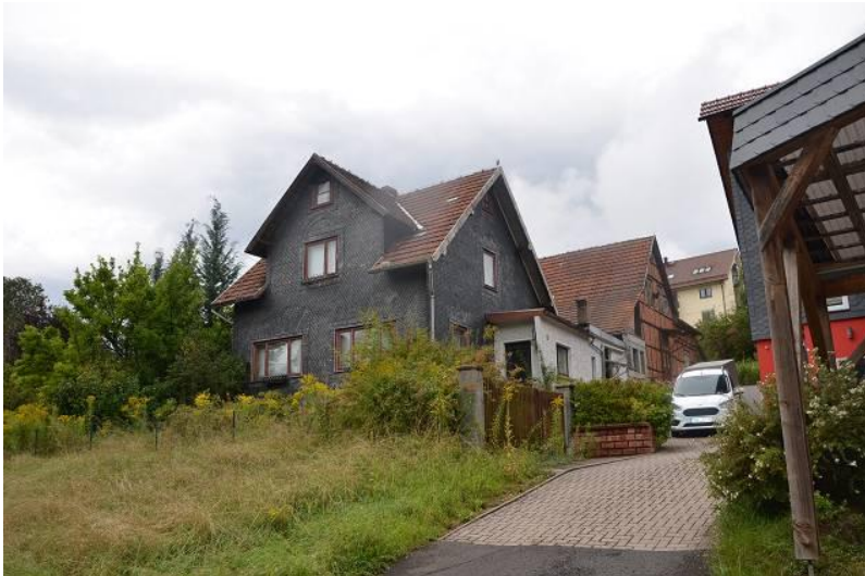
FOTOS 1-15 WOHNHAUS BLICK AUF DAS WOHNHAUS IM HINTERGRUND NEBENGELASS