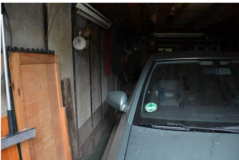
Foto 30 GARAGENINNENBEREICH