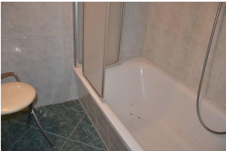
Foto 14 BADEZIMMER IM KELLER