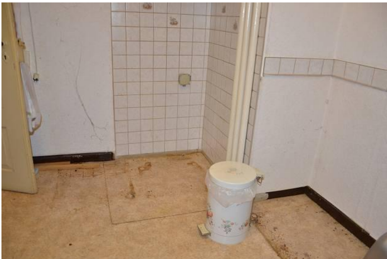
Foto 11 KÜCHE