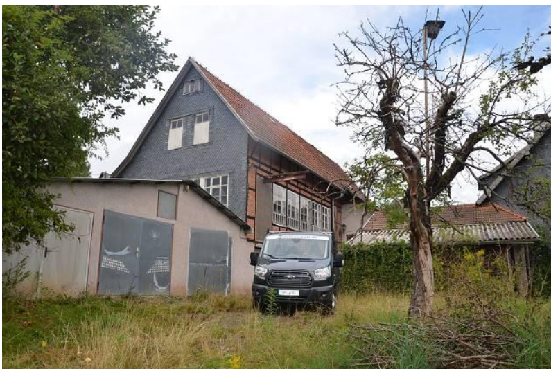
Foto 20 NEBENGELASS