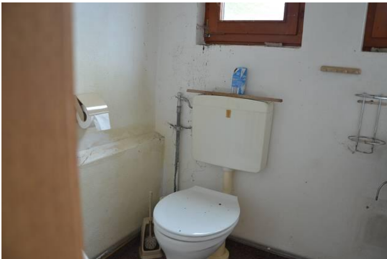
Foto 26 WC FÜR LAGERBEREICH