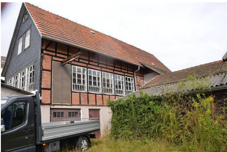
Foto 18 NEBENGEBAUDE