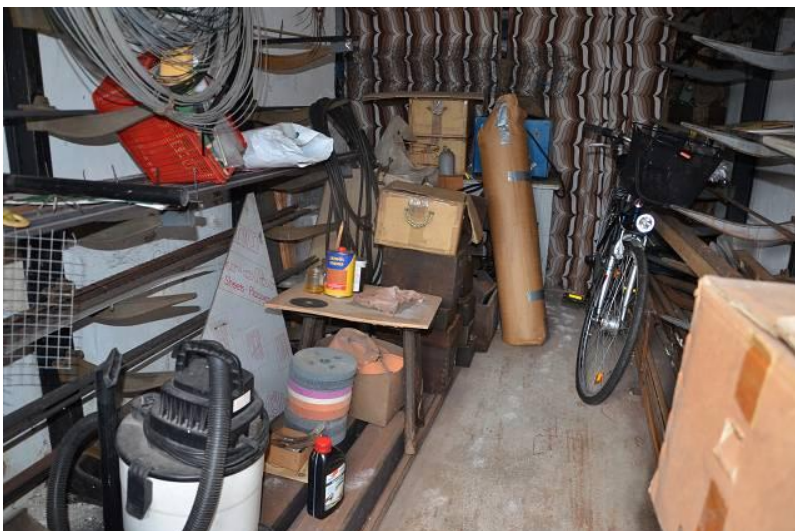
Foto 27 LAGERRAUM IM ERDGESCHOSS