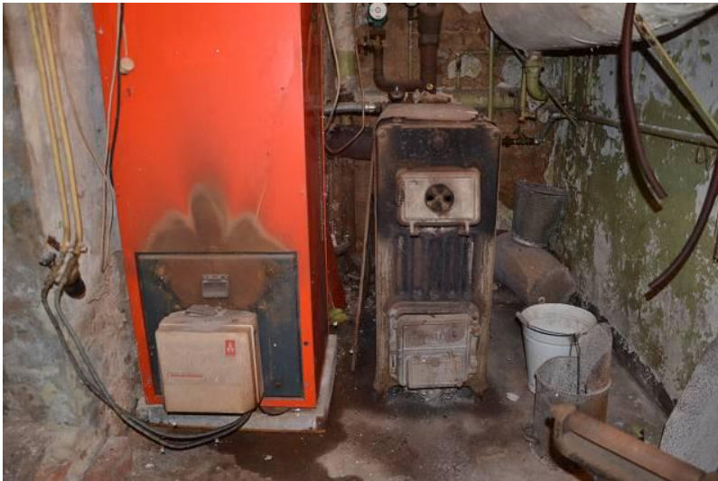
Foto 28 HEIZUNG FÜR LAGERBEREICH