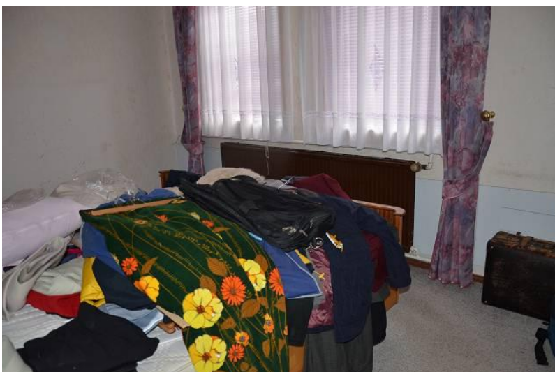
Foto 6 SCHLAFZIMMER IM DACHGE- SCHOSS