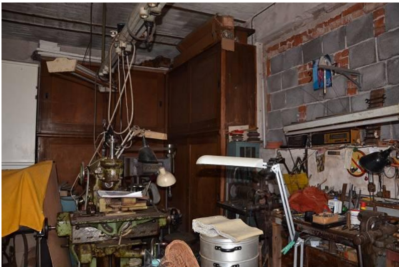
Foto 17 WERKSTATT IM ZWISCHENBAU