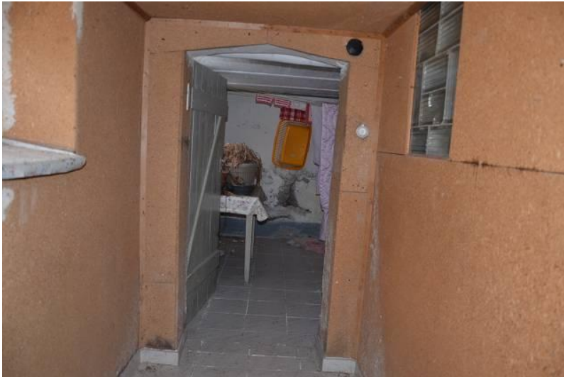
Foto 13 KELLERBEREICH