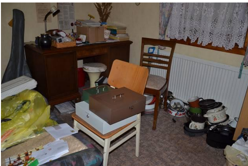
Foto 12 RAUM IM ERDGESCHOSS