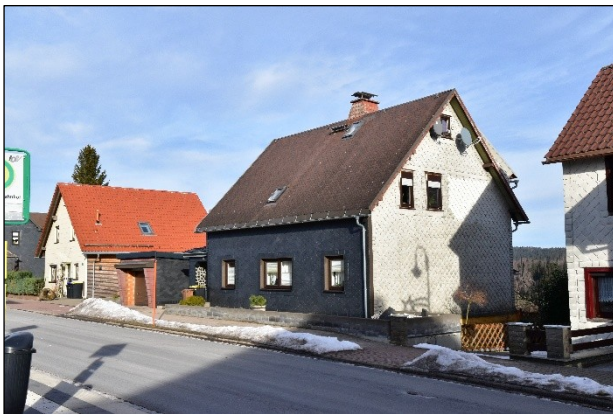
Wohngrundstück mit Wohnhaus und Garage Südwestansicht