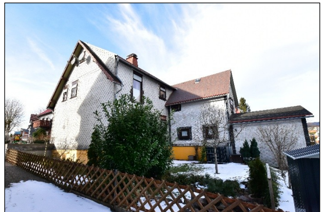
Wohngrundstück, Zweifamilienhaus mit Anbauten Südostansicht