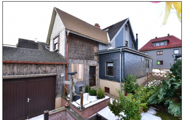
Zweifamilienhaus mit Anbauten, Hofansicht von Nordosten