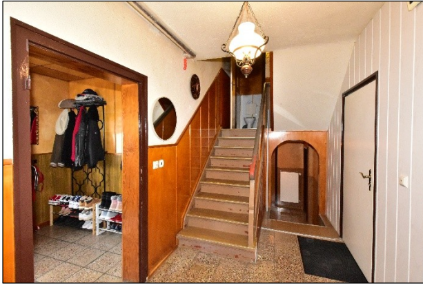
Zweifamilienhaus, Erdgeschoss, Hausflur / Treppenhaus mit Blick zum Eingangsvorbau, zum WC Anbau Obergeschoss und zum Nebenflur Bad / WC (v. l. .n. r.)