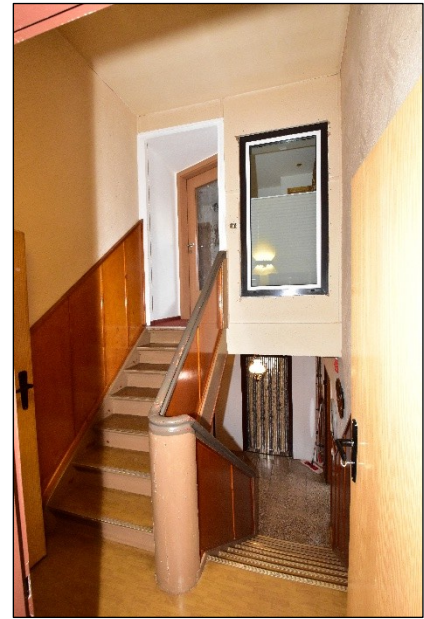
Treppenhaus mit Wohnungstür Ober- / Dachgeschoss