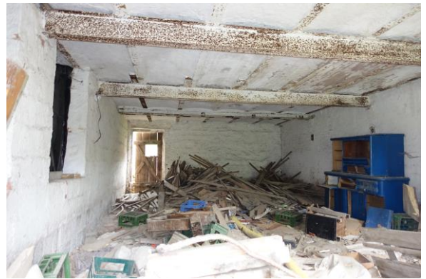
Schuen/ Lagerraum im EG