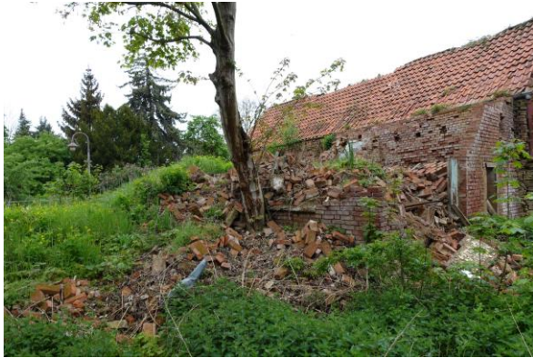
Bauschutt/ Fragmente aus dem Abriss

Objekt: 99706 Sondershausen OT Kleinberndten, Vor der Wohlruthe 3