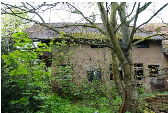
rückwärtige Ansicht Scheune