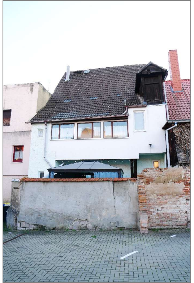
Wohnhaus - Nordansicht