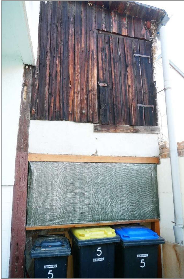
ehemaliger Stall / Schuppen