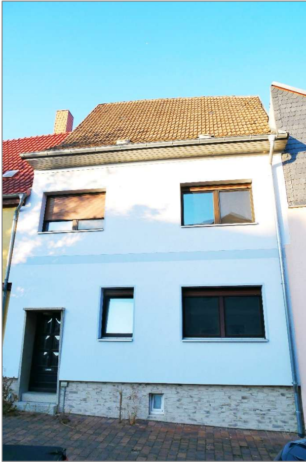
Wohnhaus - Südansicht