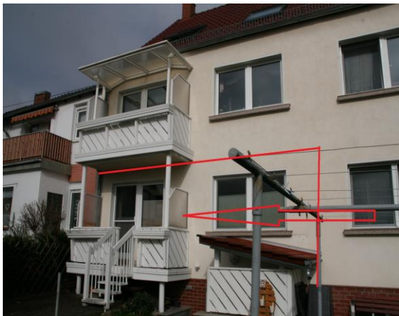
Ansicht von Süden Wohnung mit Balkon und Treppe