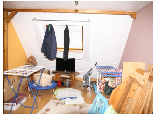
Zimmer im DG