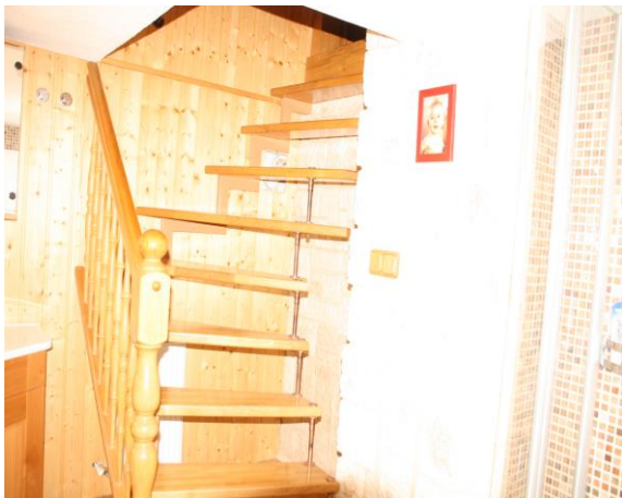
Treppe zum Bad/ WC im Keller