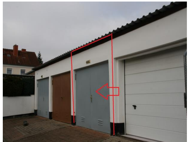
Garagenkomplex, Garage Nr. 3