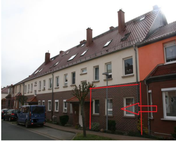
Ansicht von Norden

Objekt: 99759 Sollstedt, Kolonie 121/122, ETW EG-re./ Eingang 121