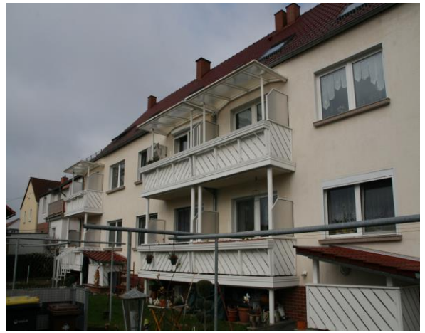
Ansicht von Süden