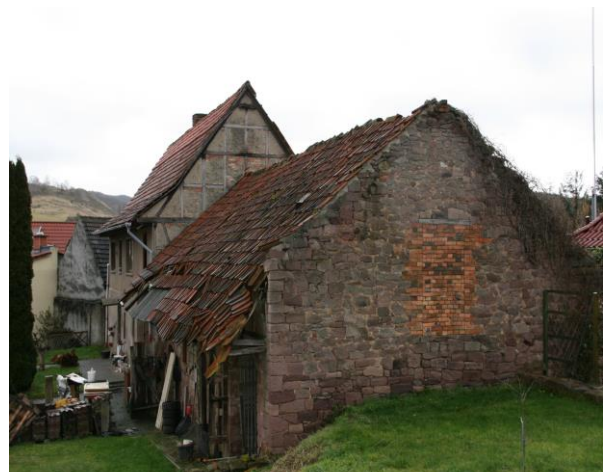
Stallung/ Ansicht von Norden