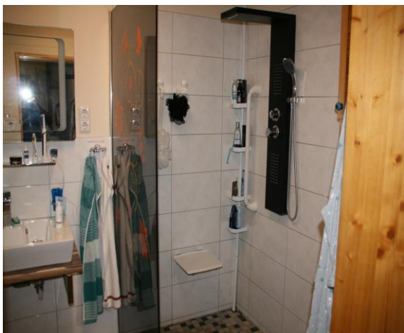
Bad/ WC im EG (neuwertig/ barrierefrei)