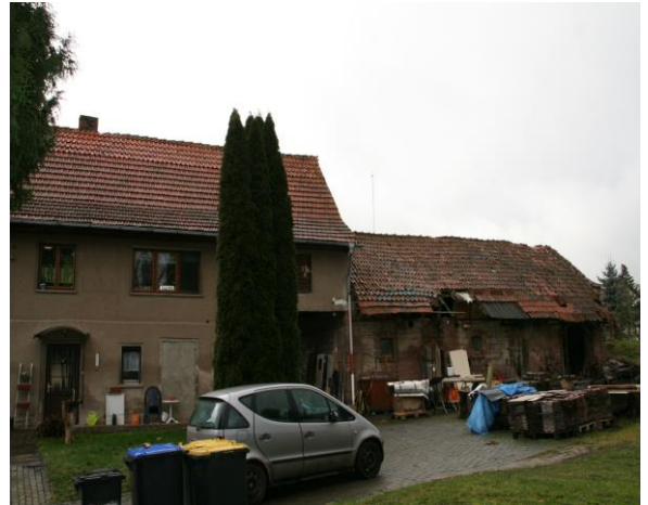
Ansicht von Osten mit angrenzender Stallung