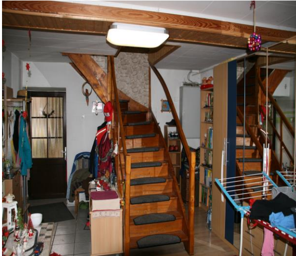
Flur/Treppenhaus im EG

Objekt: 99707 Kyffhäuserland OT Steinhäleben, Johannisplatz 2