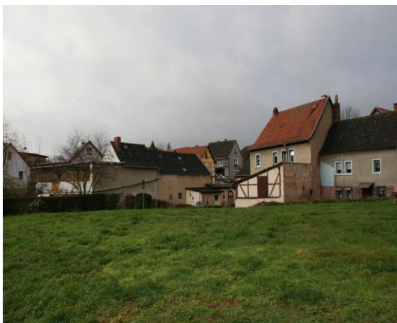
Grundstücksteilfläche (sep. bebaubar)