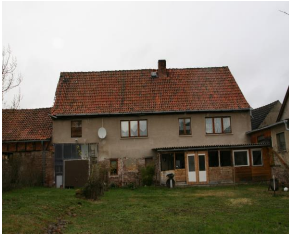
Ansicht von Westen

Objekt: 99707 Kyffhäuserland OT Steinhaleben, Johannisplatz 2