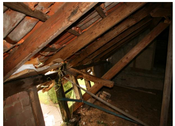
Stallung, abgängiger Drenpel