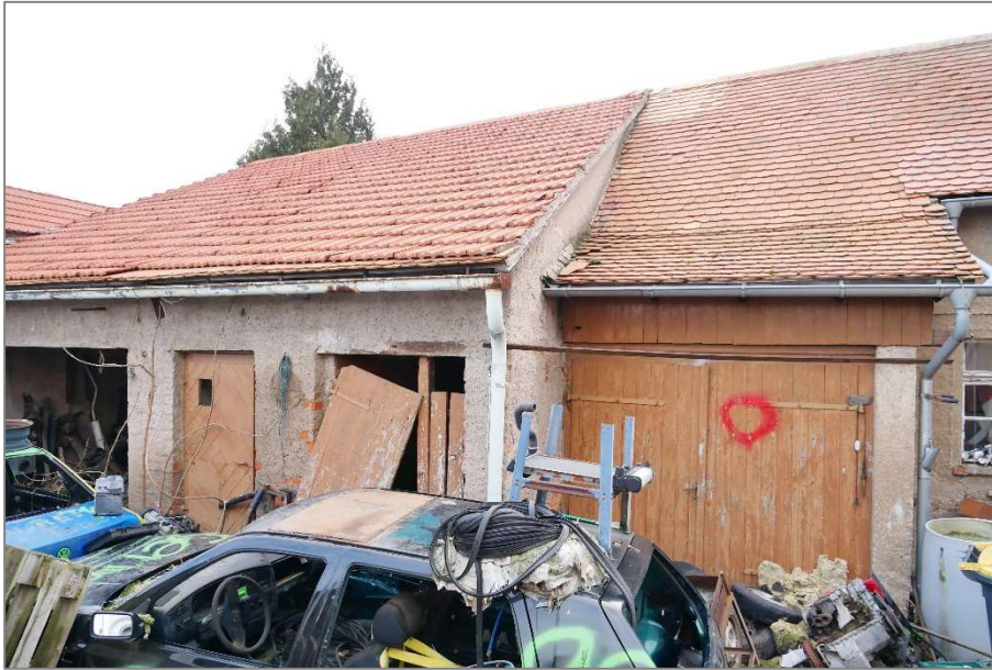
Nebengebäude 2 - Westansicht