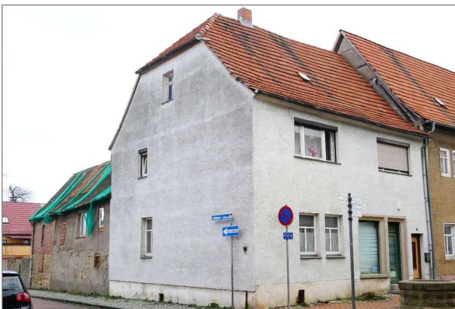
Wohnhaus - Südwestansicht