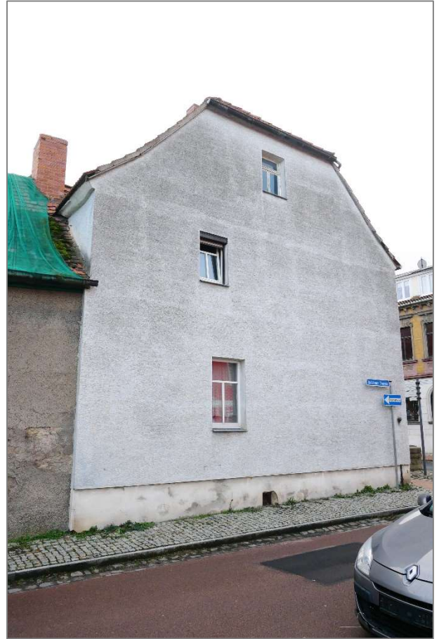
Wohnhaus - Nordwestansicht