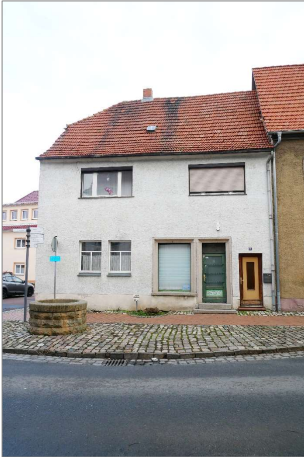
Wohnhaus - Südansicht