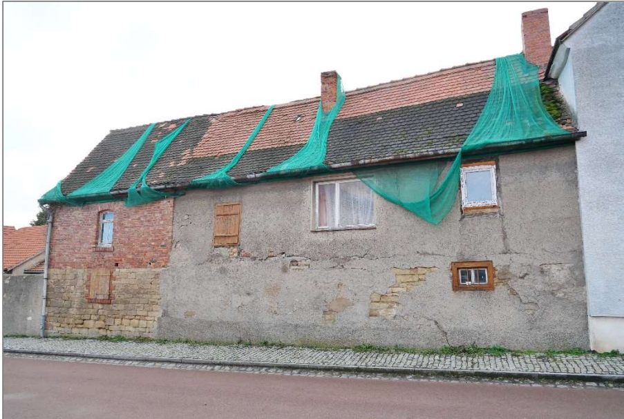
Nebengebäude 1 - Westansicht