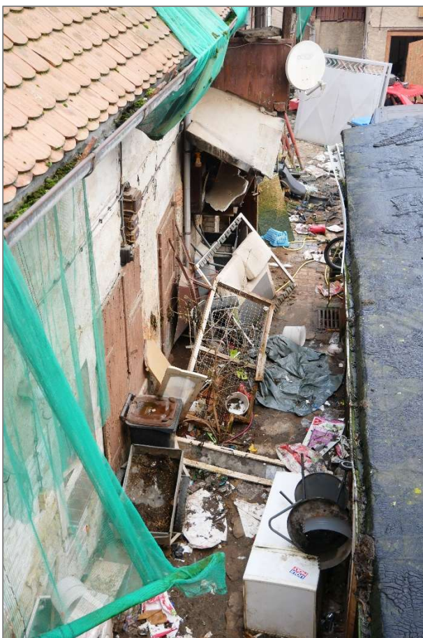
Schuppen - Hof- und Freifläche