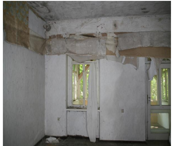
Zimmer im OG