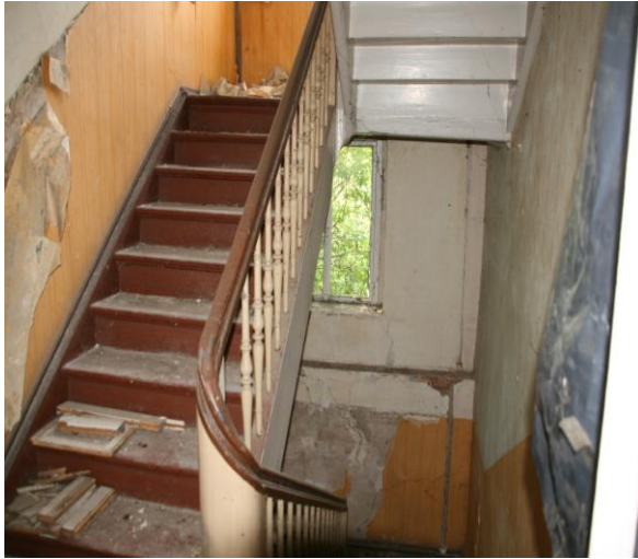
Treppenhaus im OG