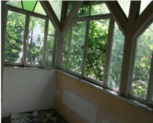
Balkon im OG