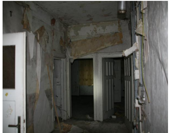
Flur WE im EG