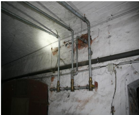
Keller, vorgerüstete Gaszählerplätze