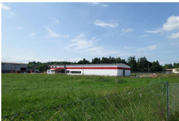
Ansicht von Südosten/ Halle mit Erweiterungs- fläche