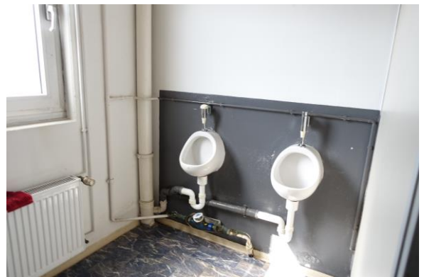
WC-s; hier 2 * PP