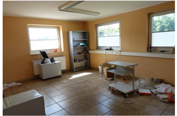
Büro im EG