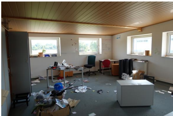
Büro im OG