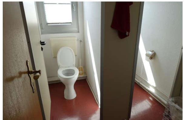
WC im OG