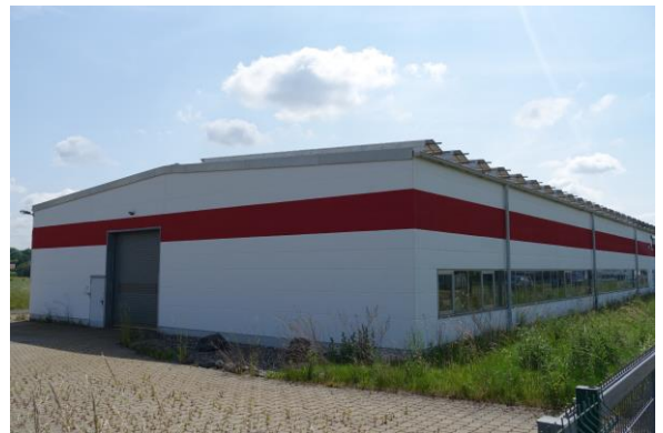
Ansicht vom Nordosten/ Giebel mit Einfahrt in die Halle