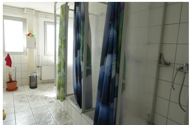
Duschräume Büro- u. Sozialtrakt/ EG