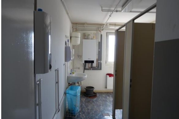
WC-s, Büro- ui. Sozialtrakt im EG