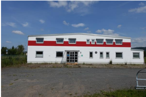
Ansicht von Westen/ Büro- u. Sozialtrakt