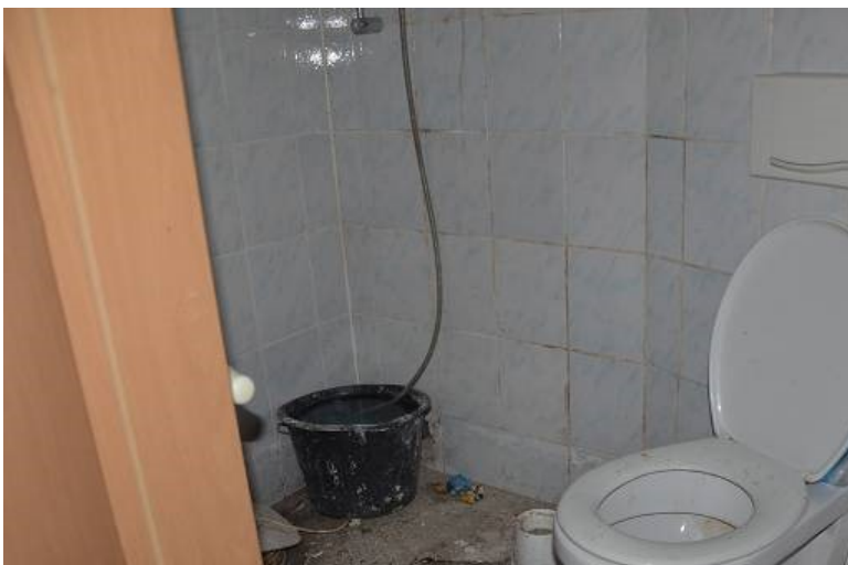
FOTO 12 WC/ DUSCHE IM ERDGESCHOSS