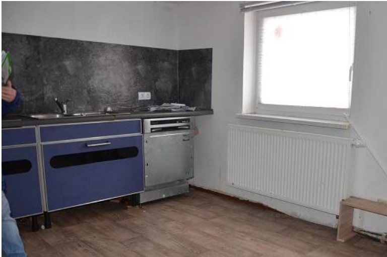
FOTO 10 KÜCHE IM ERDGESCHOSS