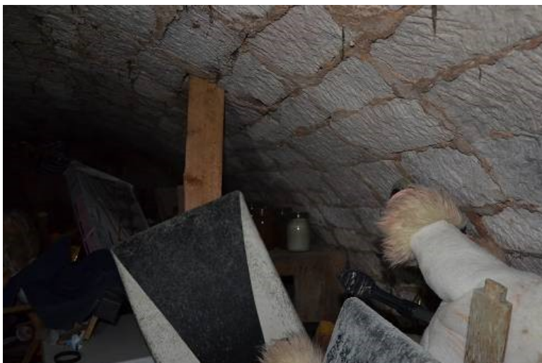
FOTO 15 GEWÖLBKELLER