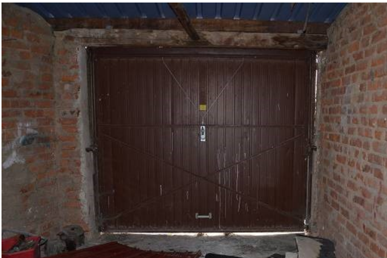
FOTO 14 GARAGENINNENRAUM