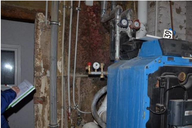
FOTO 13 HEIZUNGS- UND ABSTELLRAUM IM ERD-GESCHOSS ANBAU