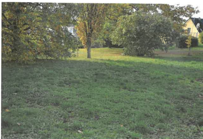
Foto 3 AUßENANLAGEN HINTERRAUM