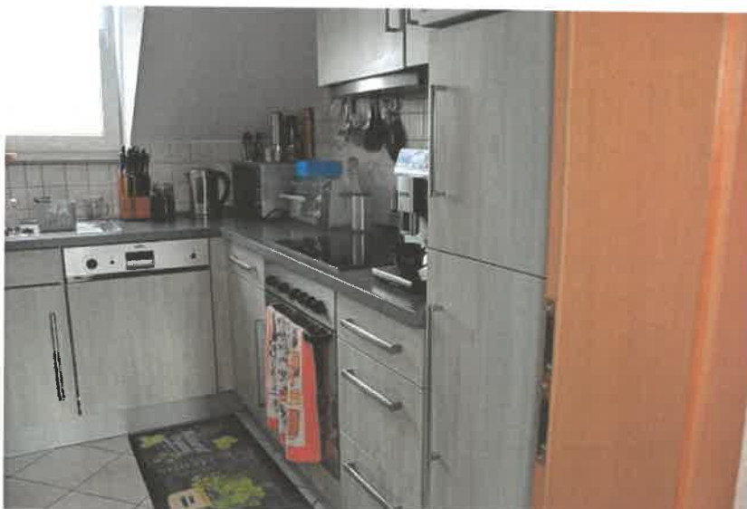
FOTO 9 KÜCHE