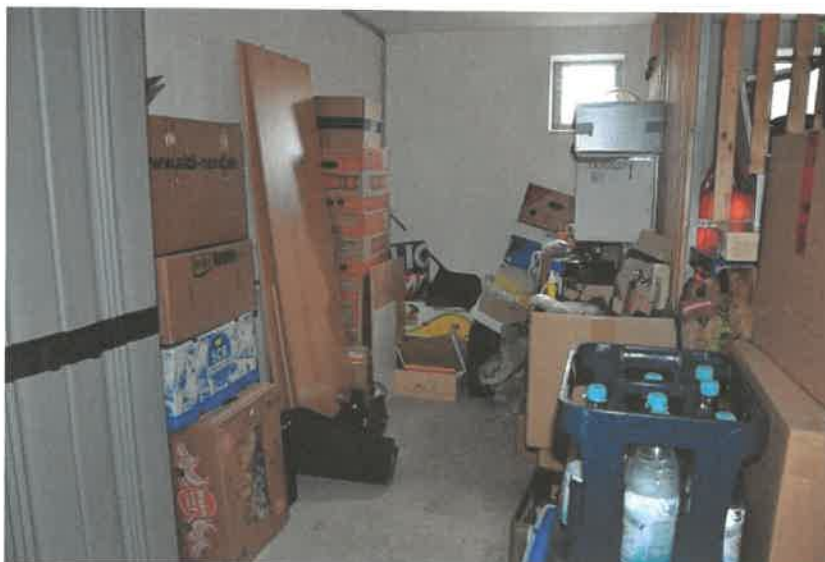
FOTO 12 ABSTELLRAUM IM KG