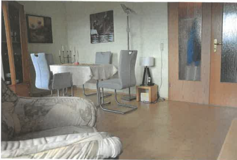
FOTO 10 WOHNZIMMER