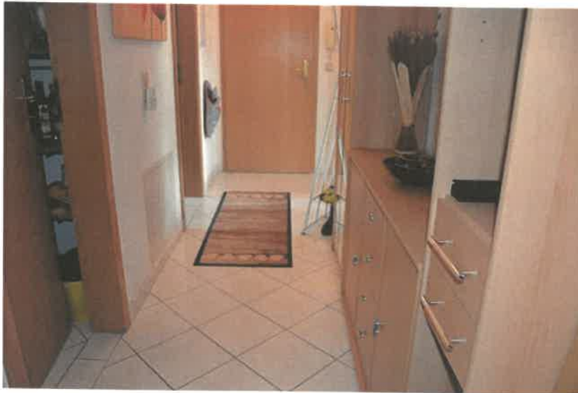
FOTO 7 VERTEILERFLUR WOHNUNG