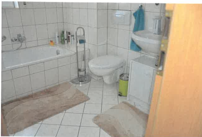
FOTO 8 BAD