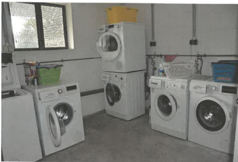
FOTO 14 WASCHMASCHIENENRAUM