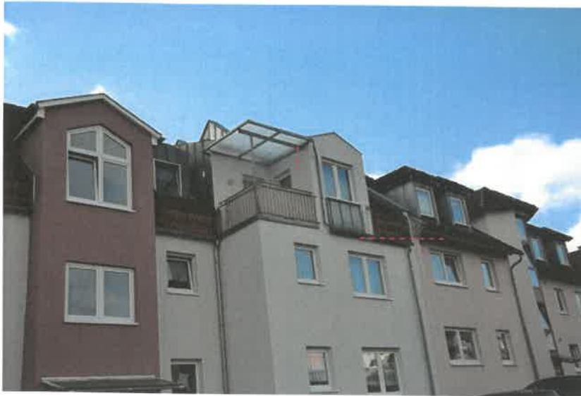
Fotoa 1-6 Allgemeine Ansichten zum Gebäude und Grundstück