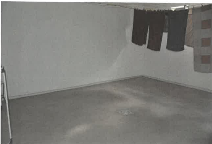
FOTO 15 TROCKENRAUM