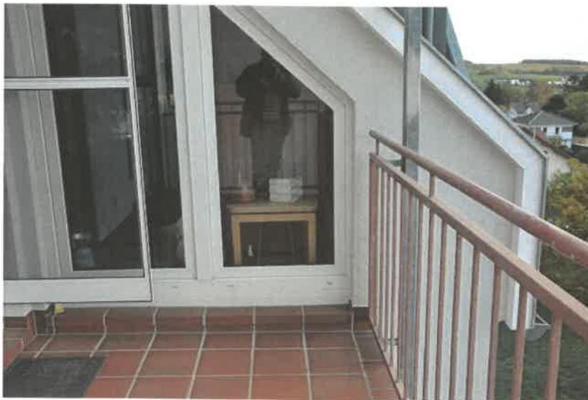
FOTO 11 BALKON