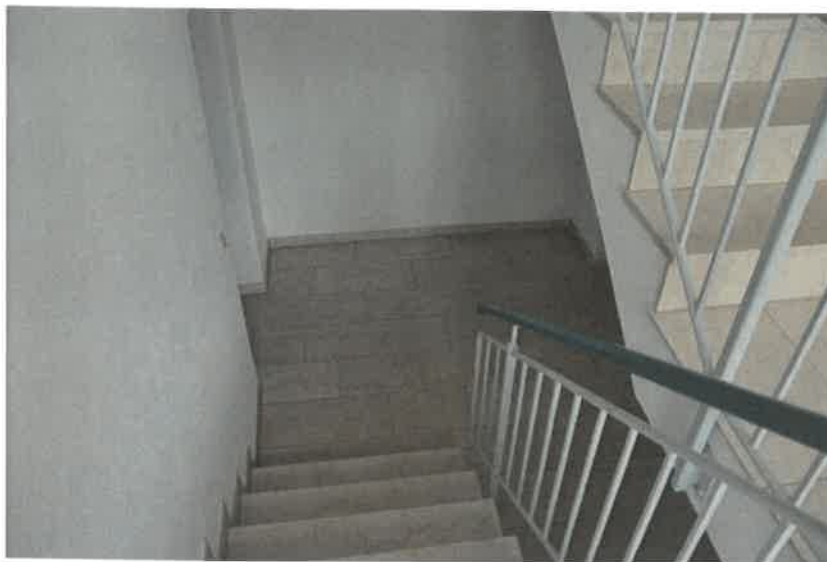
FOTO 13 TREPPENRAU