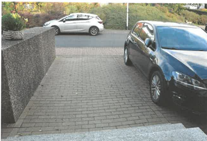
FOTO 6 EINGANGSBEREICH