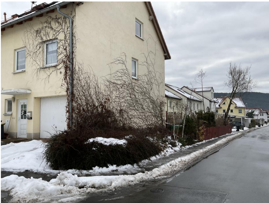
Bebauung in der Straße