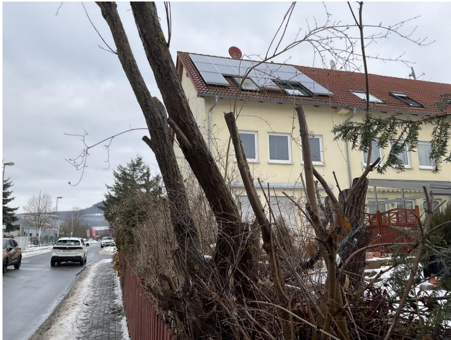
Gartenseite mit PV Anlage