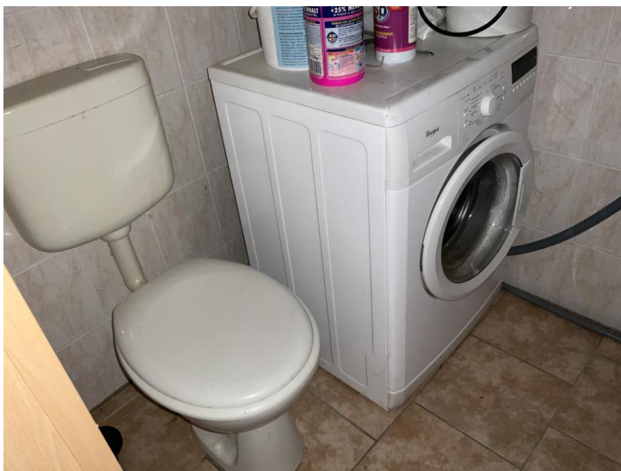
EG Gäste WC