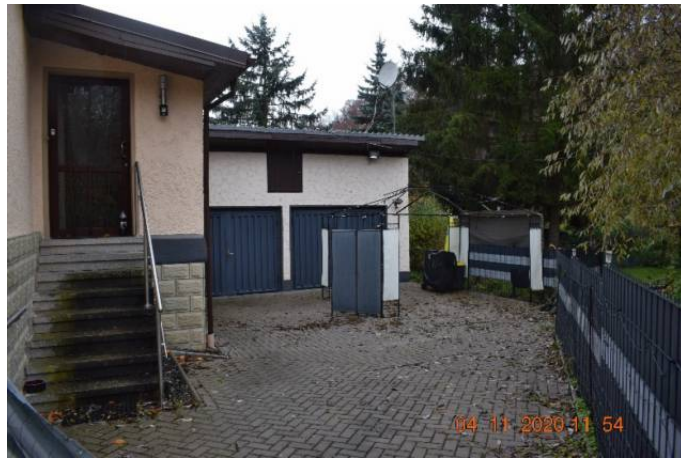
Hofbereich mit Garagengebäude