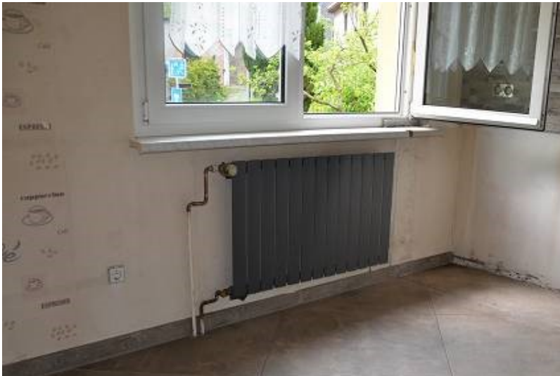
Foto 10 EHEMALIGE KÜCHE IM ERDGE- SCHOSS