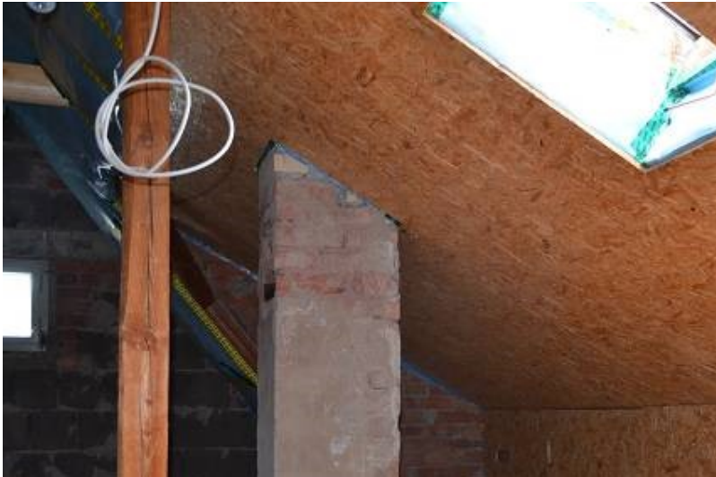
FOTOS 4 DACHRAUM