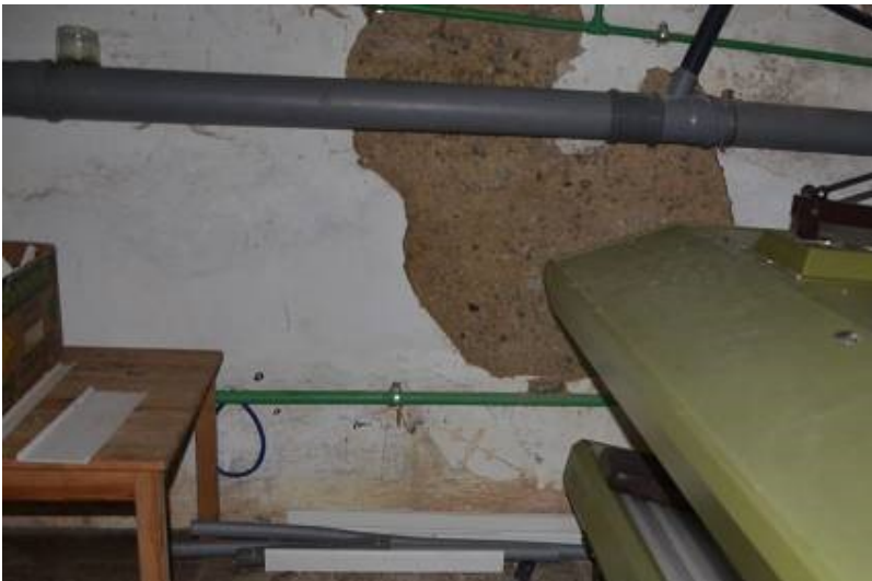
FOTO 14 KELLERRAUM