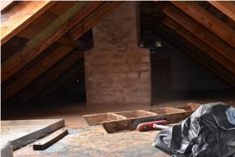
FOTO 19 SPITZBODEN