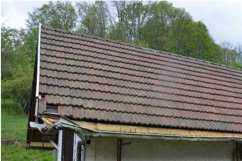
FOTO 28 NEBENGEBÄUDE ANSICHT