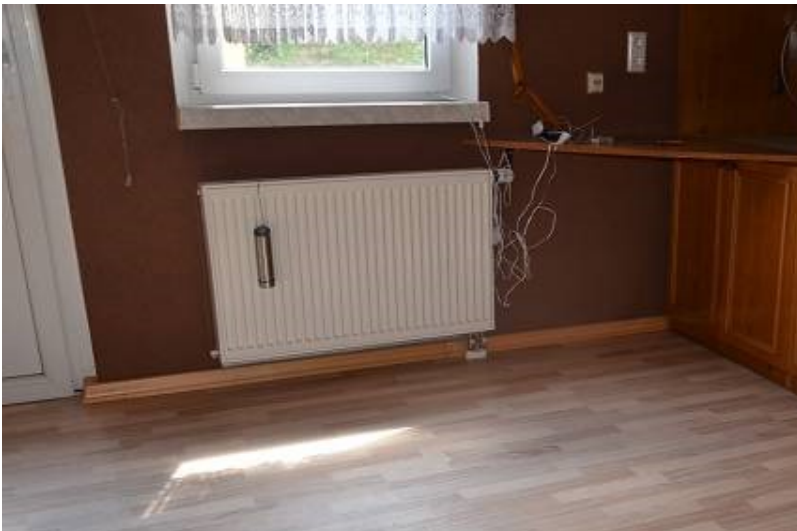
FOTO 20 WOHNZIMMER IM DACHGESCHOSS