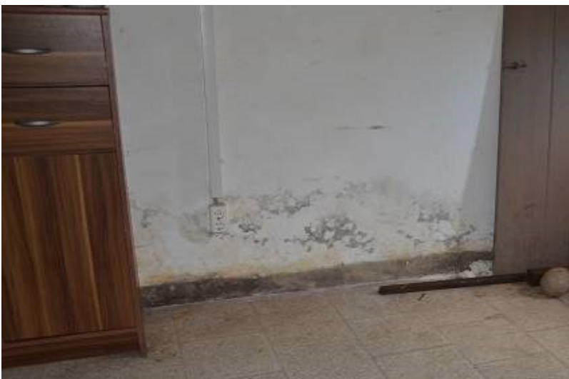
FOTO 15 KELLERRAUM