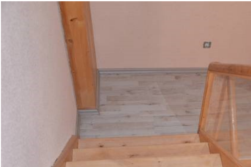
FOTO 8 TREPPENRAUM