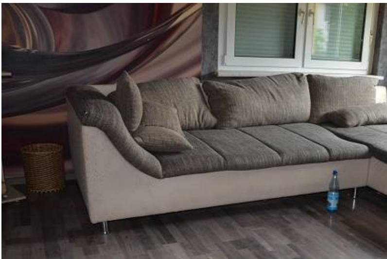
Foto 11 WOHNZIMMER