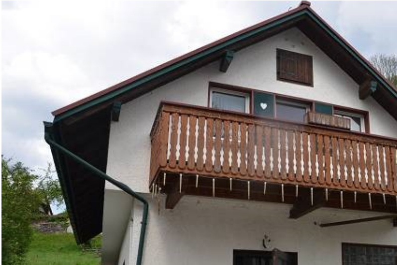
FOTO 16 WOHNHAUS 2 SÜDANSICHT