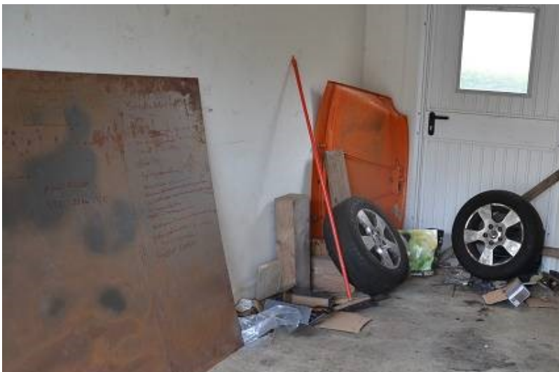
FOTO 33 GARAGENINNENRAUM