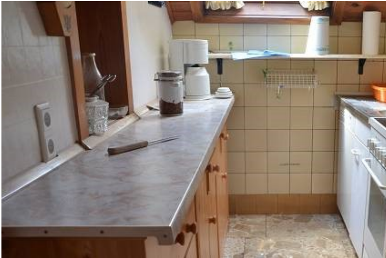
FOTO 22 KÜCHE