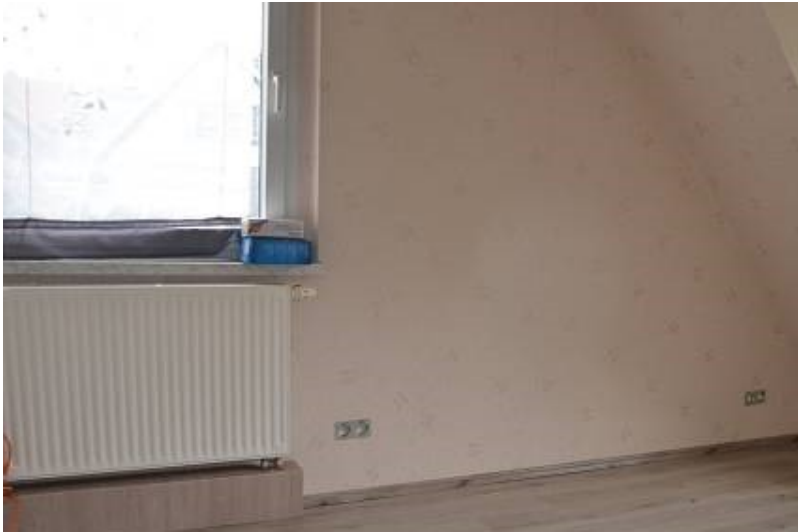
FOTO 7 SCHLAFZIMMER