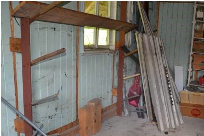
FOTO 29 INNENRAUM