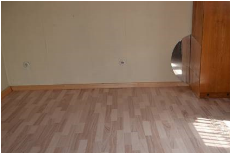
FOTO 23 SCHLAFRAUM