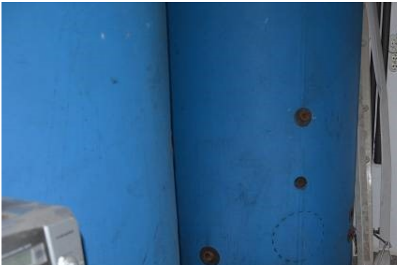
FOTO 26 KELLERRAUM