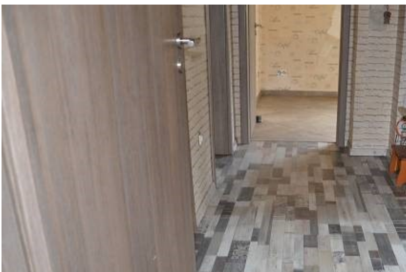
FOTO 9 FLUR IM ERDGESCHOSS