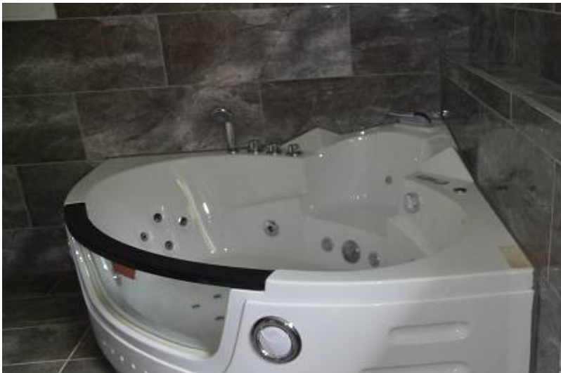
FOTO 5 BAD IM DACHGESCHOSS