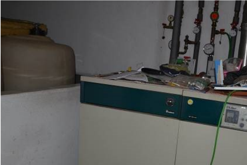
FOTO 13 HEIZUNG MIT ÖLTANKS IM KELLER- GESCHOSS