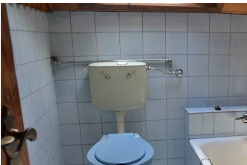
FOTO 21 BAD