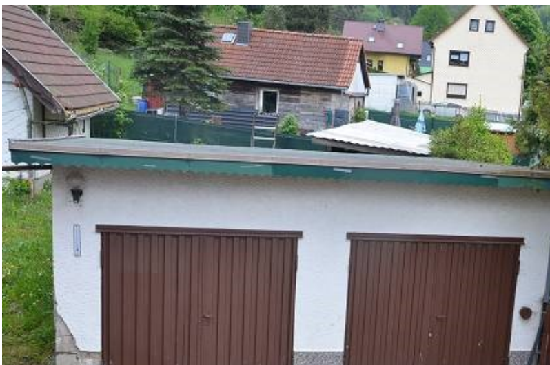
FOTO 30 ALTE DOPPELGARAGE ANSICHT