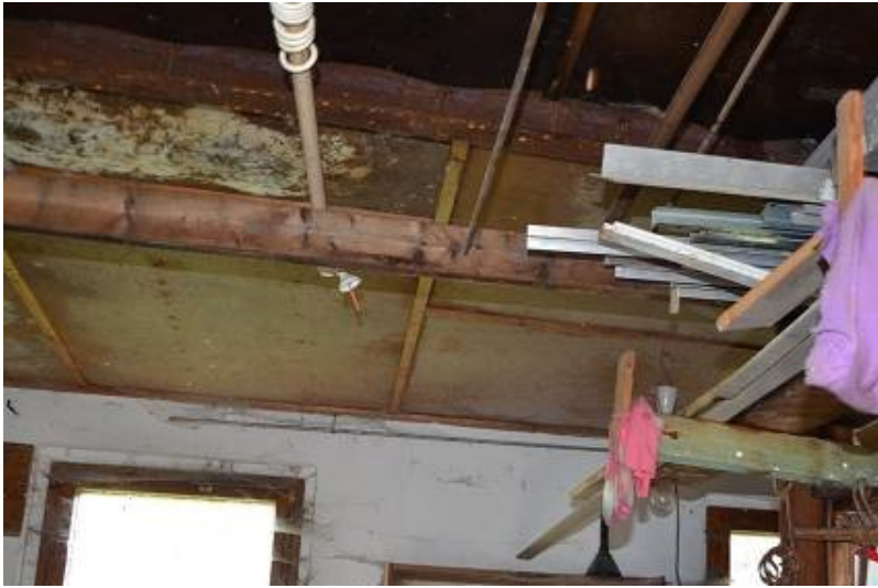
FOTO 31 INNENRAUM