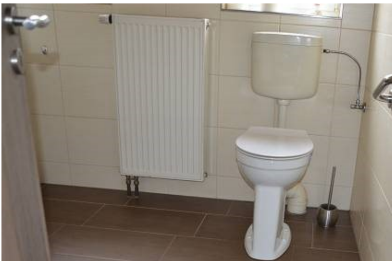
Foto 12 GÄSTE-WC