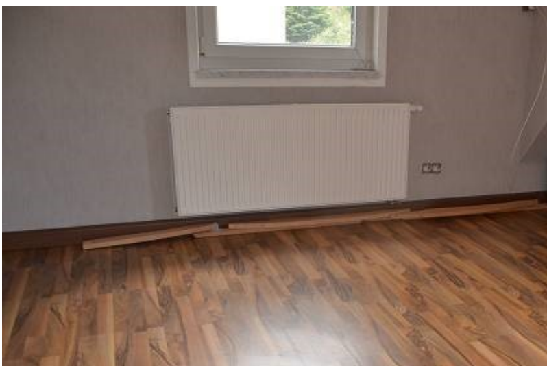
FOTO 6 SCHLAFZIMMER IM DACHGESCHOSS