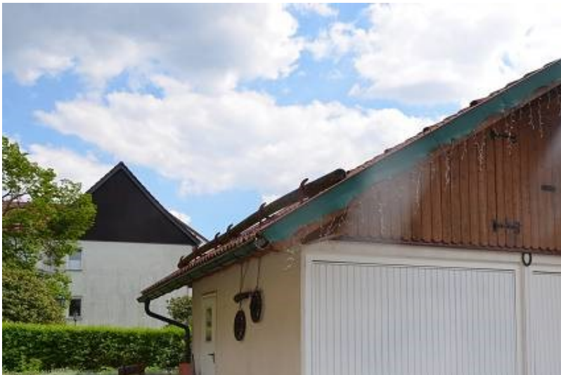
FOTO 32 NEUE DOPPELGARAGE ANSICHT