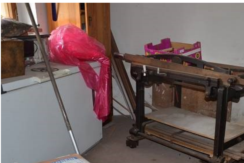
FOTO 27 KELLERRAUM