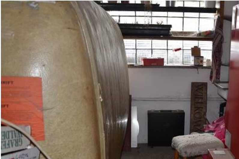
FOTO 25 HEIZUNGSKELLER