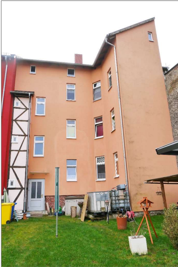
Wohnhaus - Nordansicht (Gartenansicht)