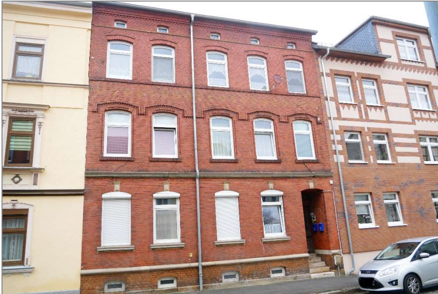
Wohnhaus - Südansicht (Straßenansicht)