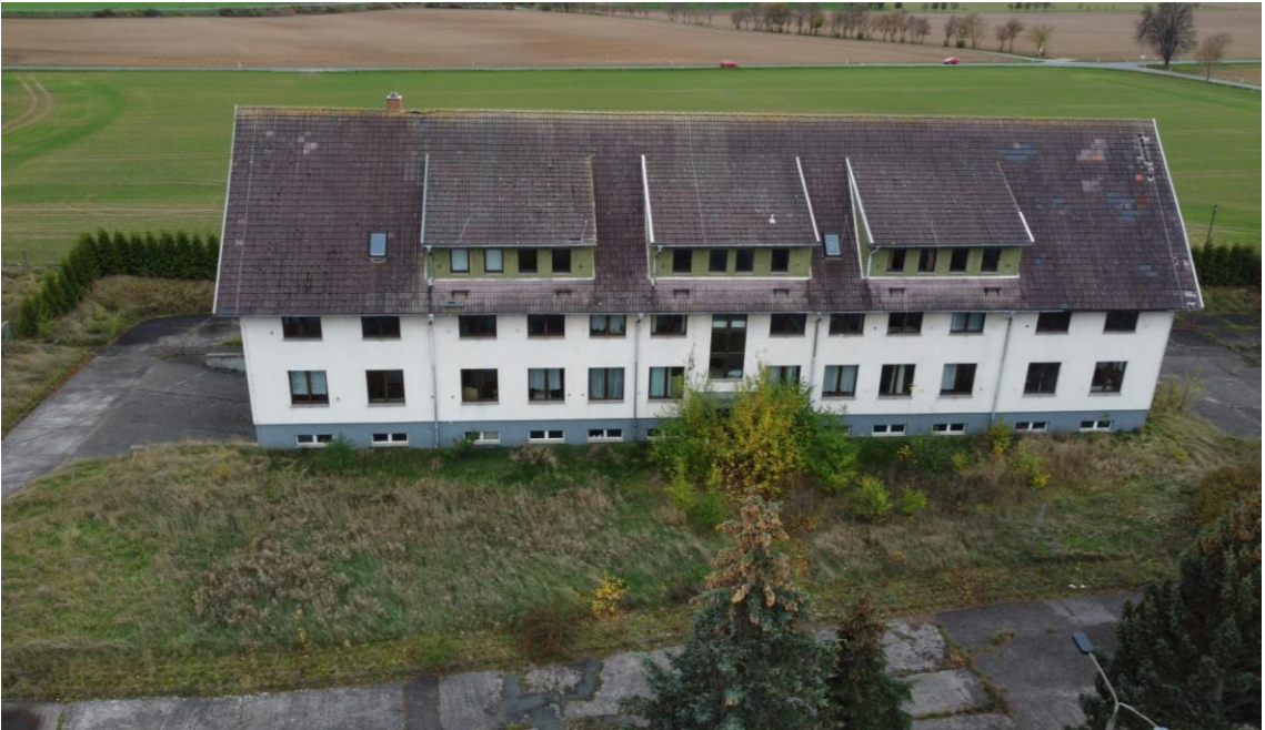
Ansicht von Norden