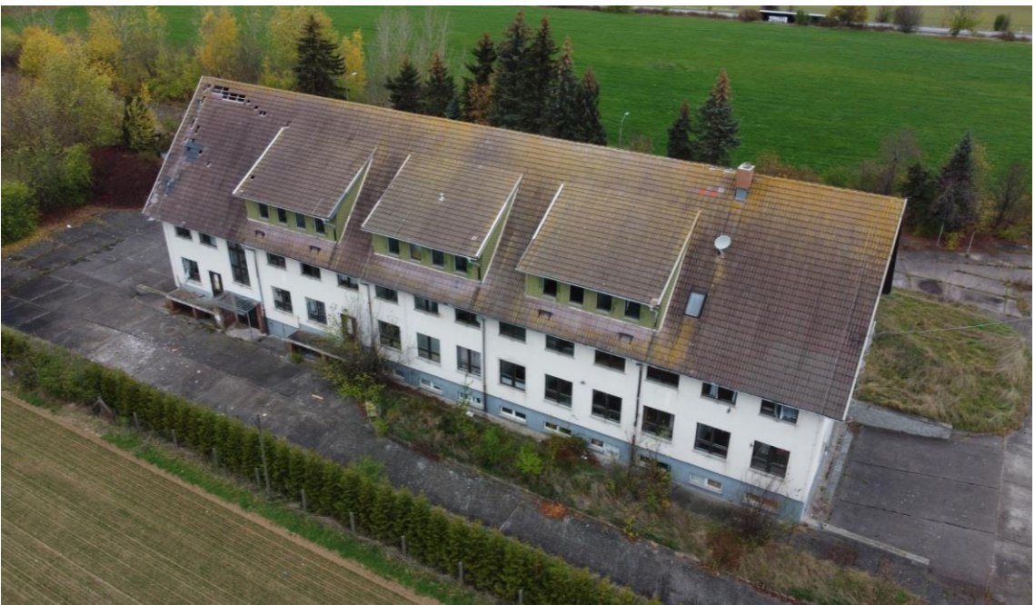
Ansicht von Süden