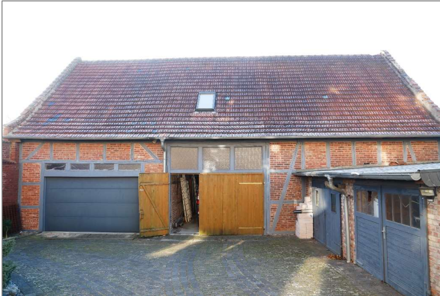
Scheune und Garagen - Nordansicht