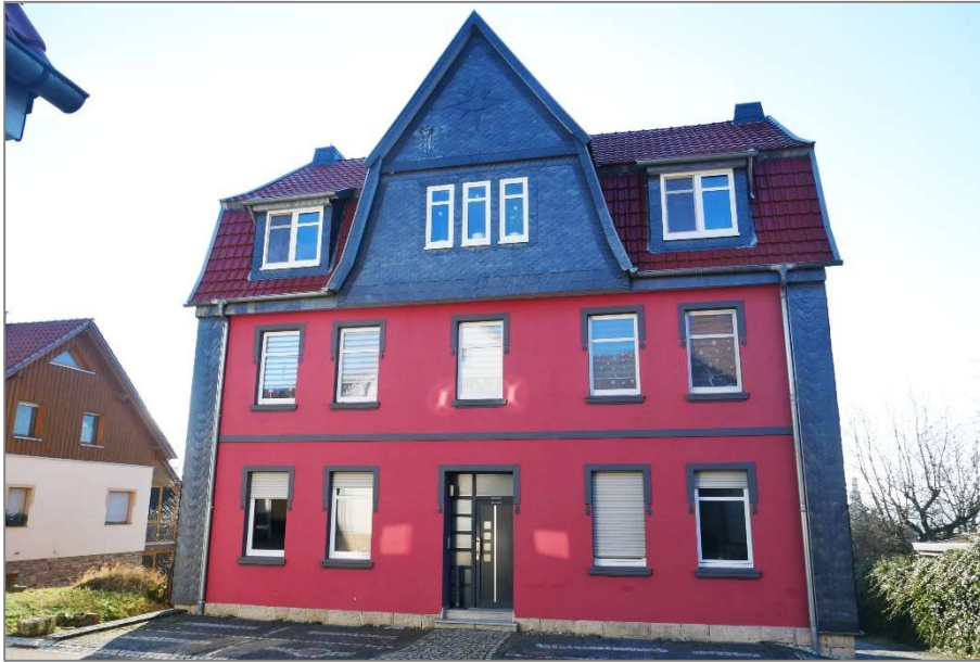
Wohnhaus - Nordansicht