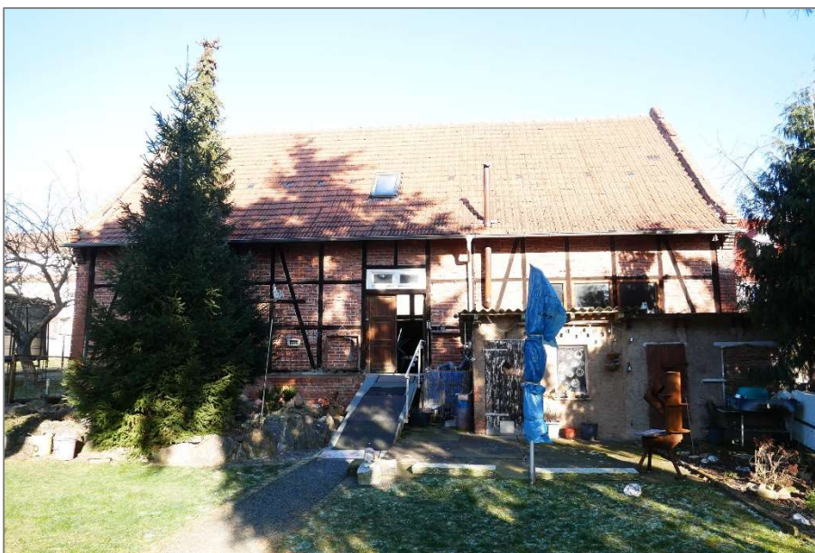
Scheune - Südansicht