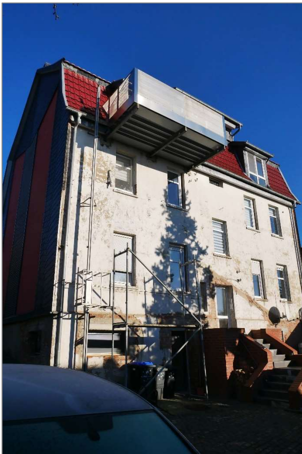
Wohnhaus - Südwestansicht