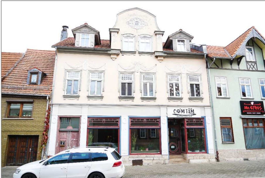
Wohn-/ Geschäftshaus - Westansicht (Straßenansicht)