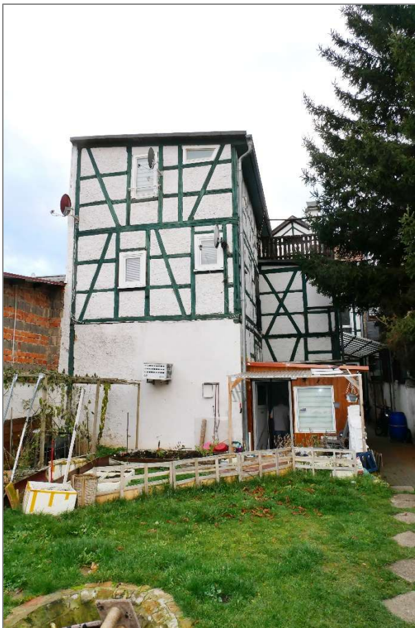
Wohn-/ Geschäftshaus - Ostansicht