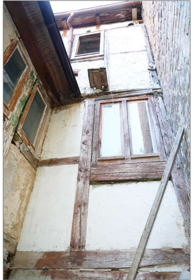
Wohnhaus - Rückansicht (Hofansicht)