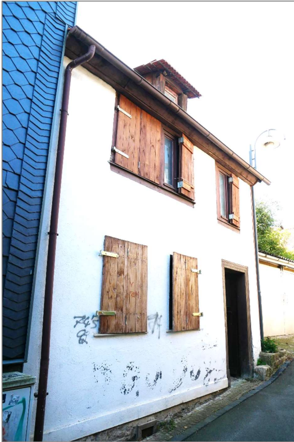
Wohnhaus - Nordansicht (Straßenansicht)