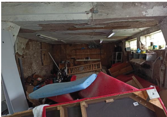
Garage im NG