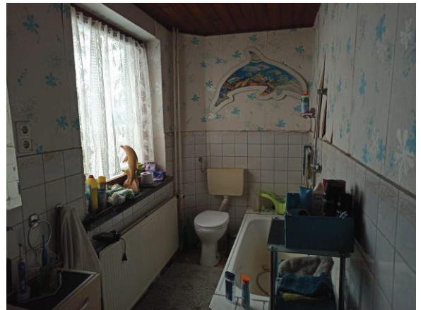
Bad im EG