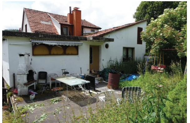
Verbinder und rückwärtiges NG mit Garage