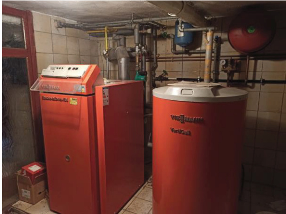
Heizung im KG

AZ: 6 K 10/24 Objekt: 37359 Großbartloff, Herztorstraße 12