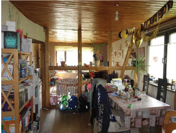
Wohnzimmer im OG