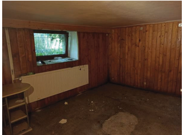
Zimmer im KG