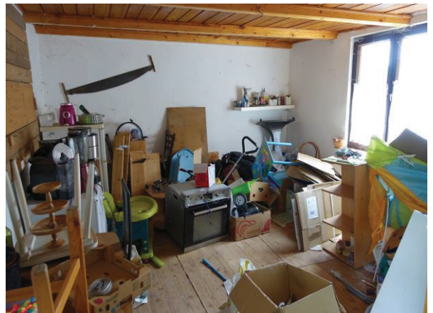
Zimmer im NG