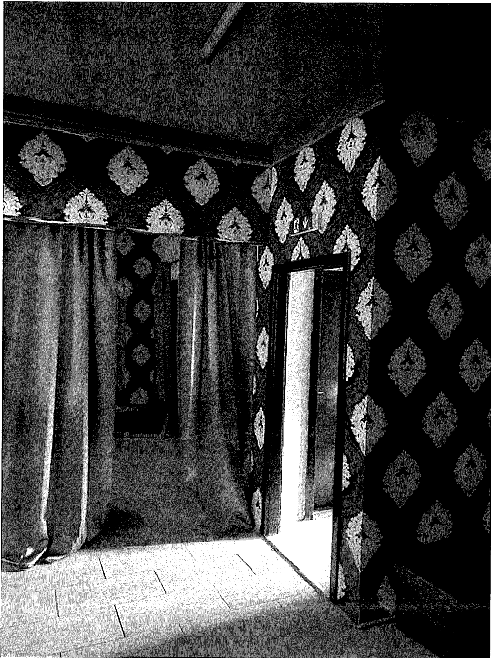
Von meinem iPhone gesendet