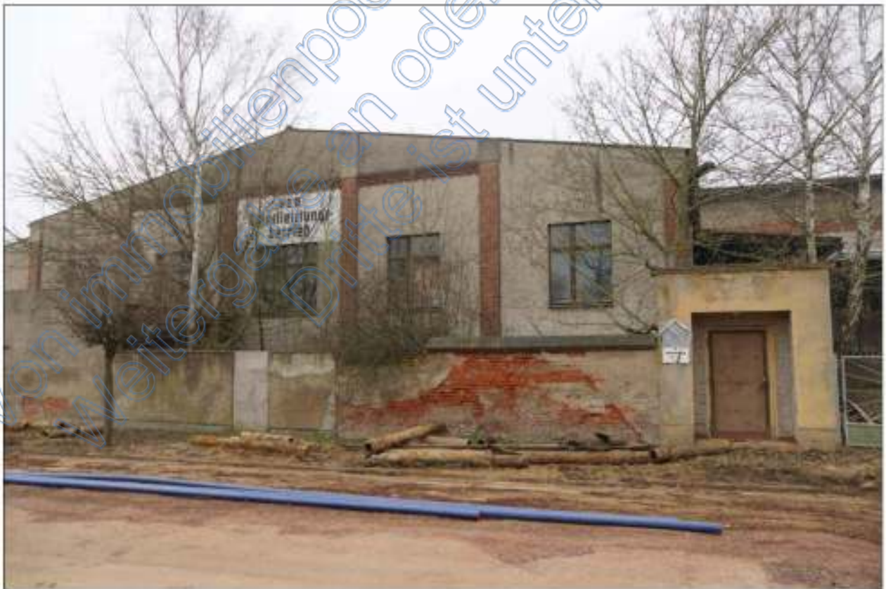
abzubrechender Gebäudeteil mit Rampe