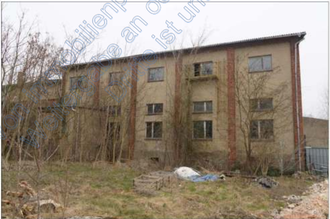
Strassenansichten des Eckgebäudes