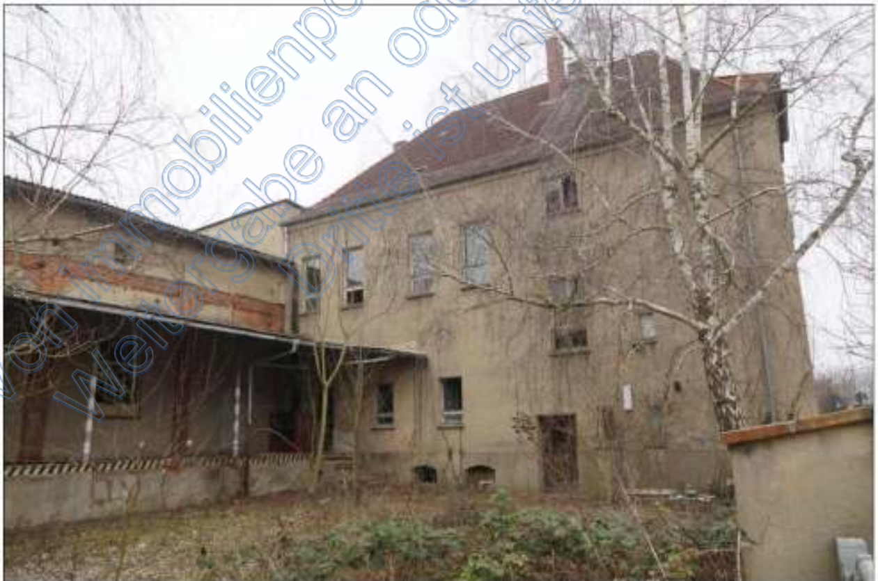
Hofansicht eines abzubrechenden Gebäudeteils