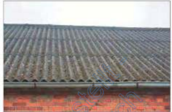
Detailansicht der Wellasbest-Dachdeckung