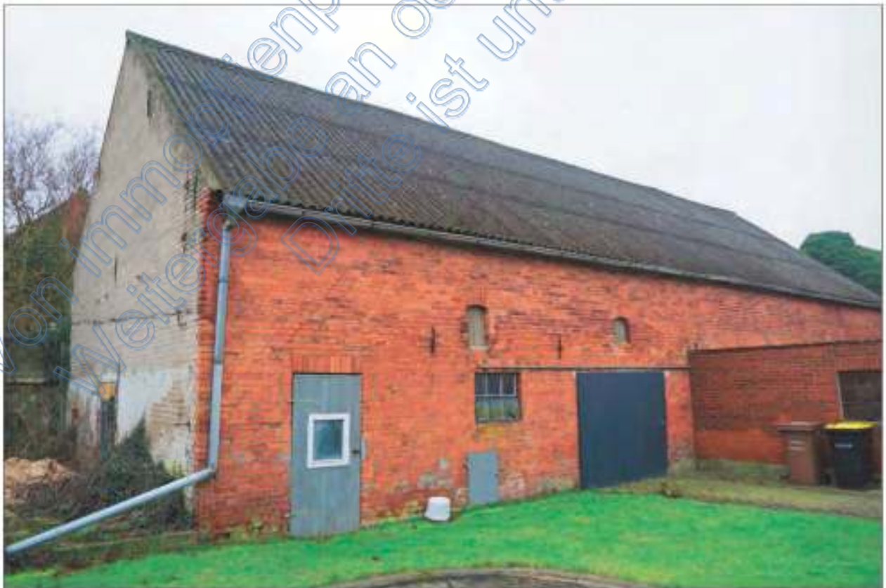
Straßenansicht des Scheunengebäudes