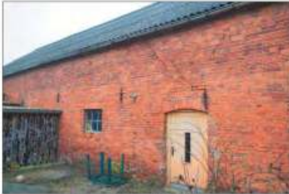
Seitenansicht mit Hofzugang