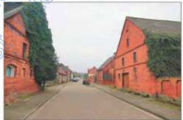
Blick in die Straße mit Bewertungsobjekt rechts