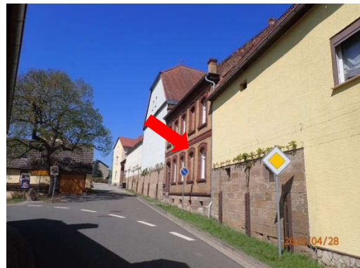
Straßenzug - Blick Richtung Westen Versteigerungsobjekt mit Pfeil gekennzeichnet