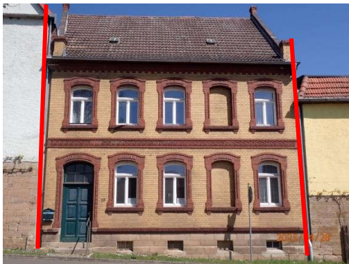
Ansicht von der Straße Fassade etwa südorientiert