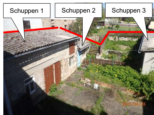
Blick aus dem Wohnhaus über den Garten

Bei dem Versteigerungsgrundstück handelt es sich um ein 344 m 2 große Grundstück, gelegen in Tröbsdorf, einem kleinen Dorf das nahezu ohne Infrastruktur ist.