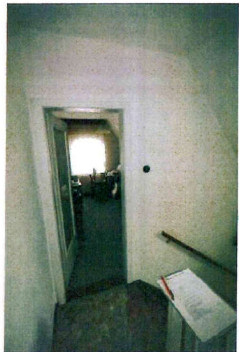
Ansicht Dachgeschossflur mit dem Zugang zum Zimmer 2.