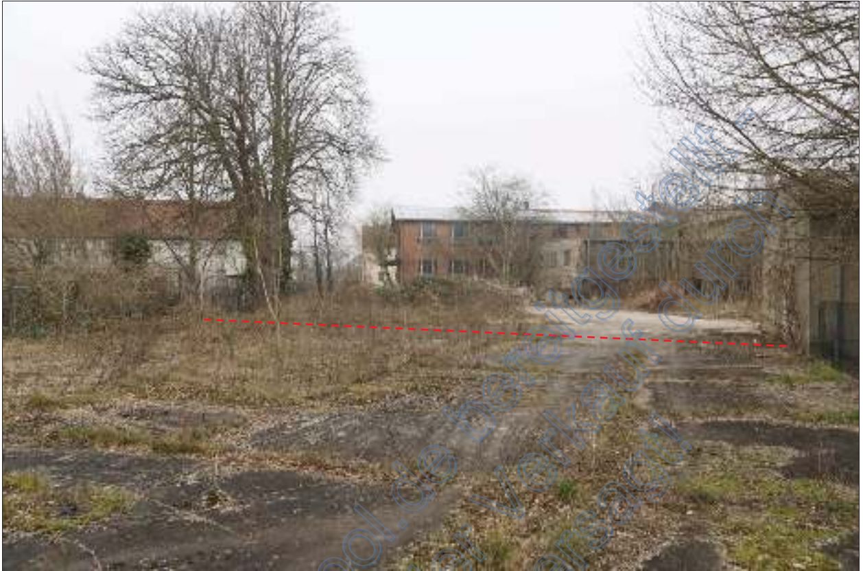
Flurstück 191/160 im vorderen Bereich (etwa bis zur Markierung)