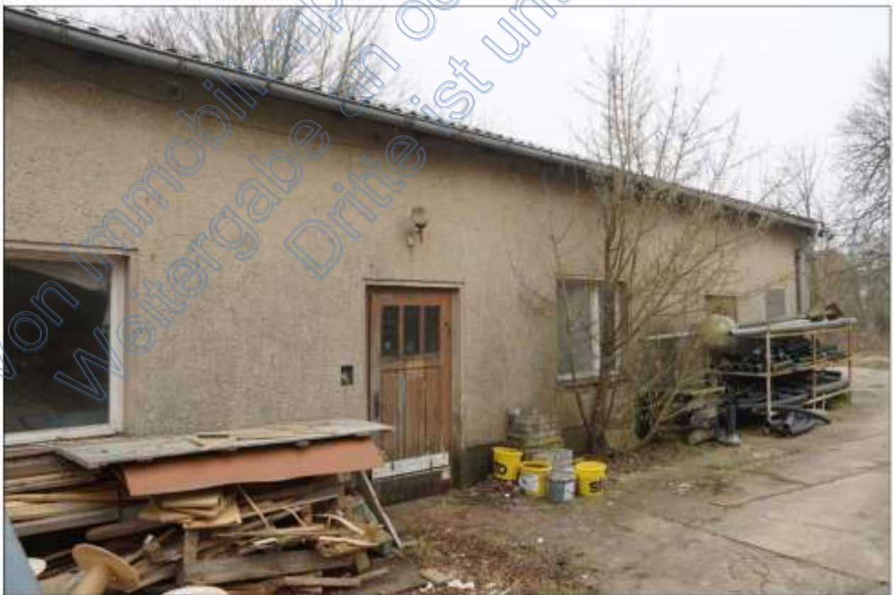
Westgiebel und südliche Gebäudefront des Lagergebäudes