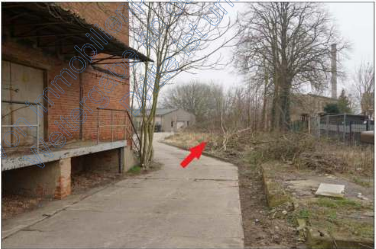
Blick vom Hof auf das unbebaute Grundstück