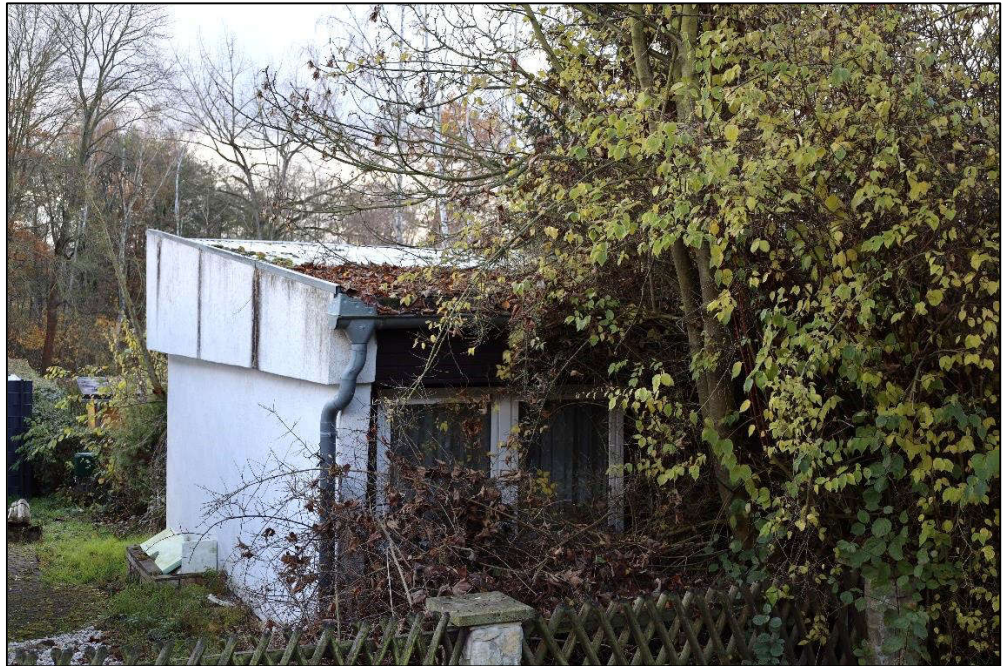
Nordansicht – Gartenbungalow