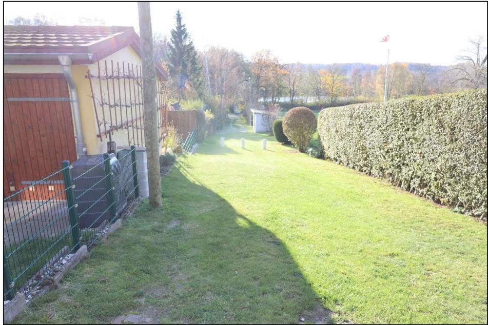
Flurstück Nr. 53 – Verkehrsfläche