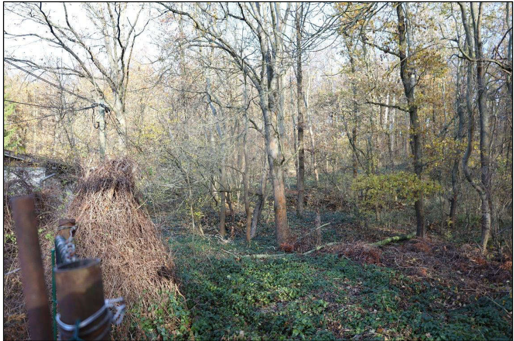
Flurstück Nr. 72 – Wald