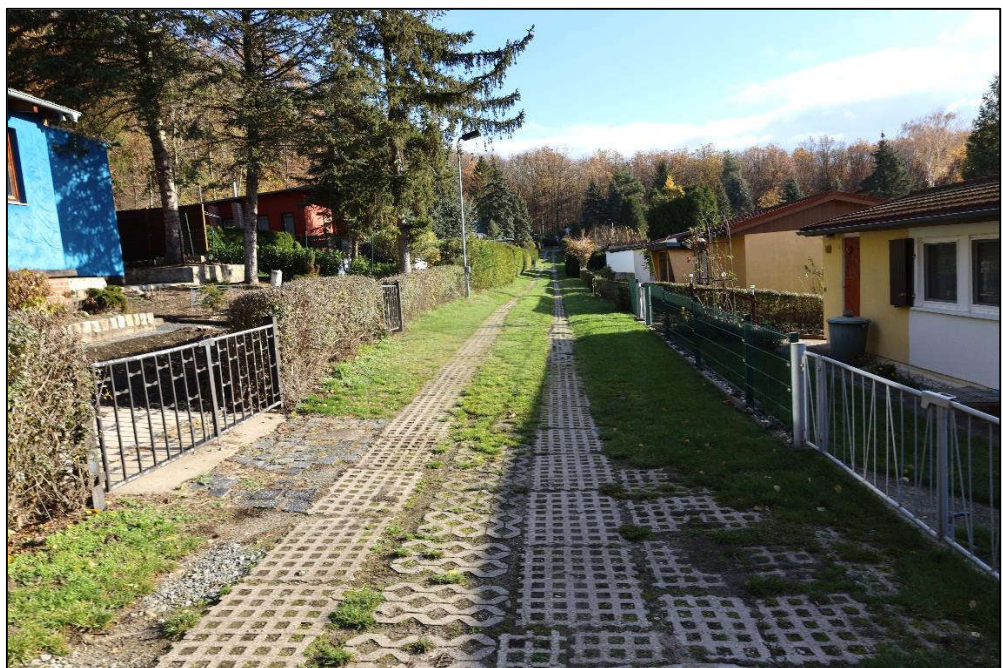
Flurstück Nr. 115 – Verkehrsfläche