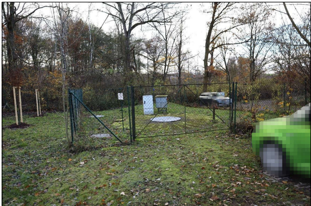
Flurstück Nr. 58 und 62 / Schächte