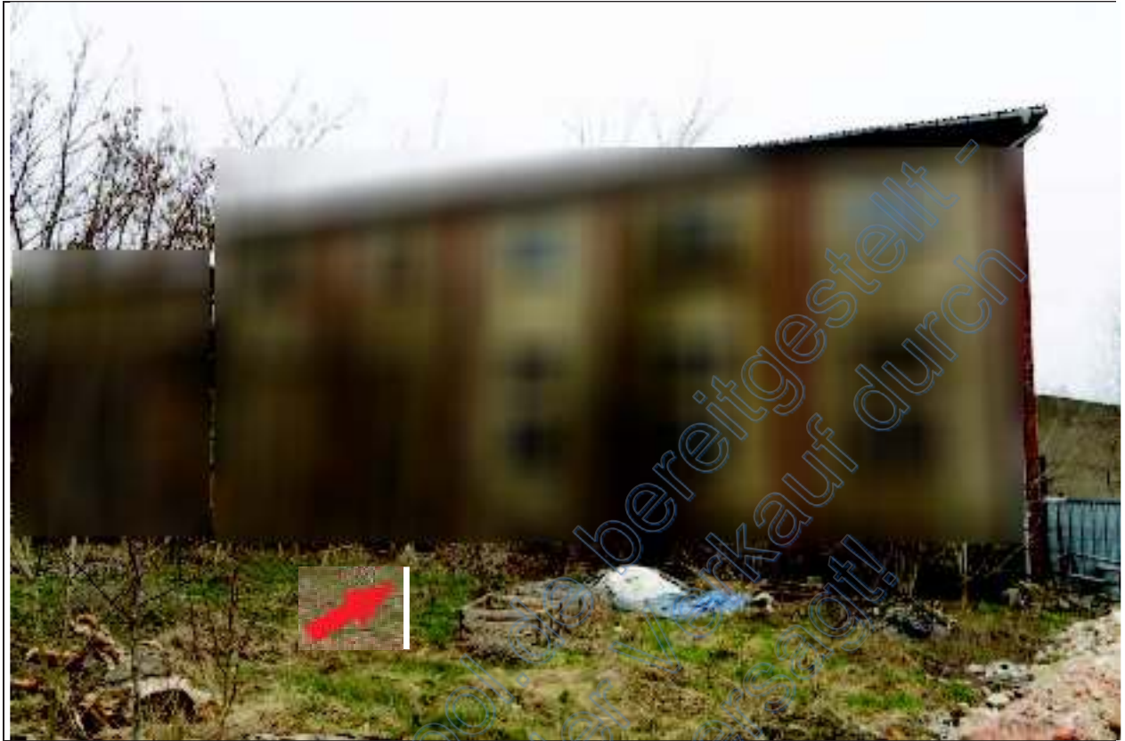
Blick vom Hofraum auf das vor dem Gebäude liegende unbebaute Grundstück