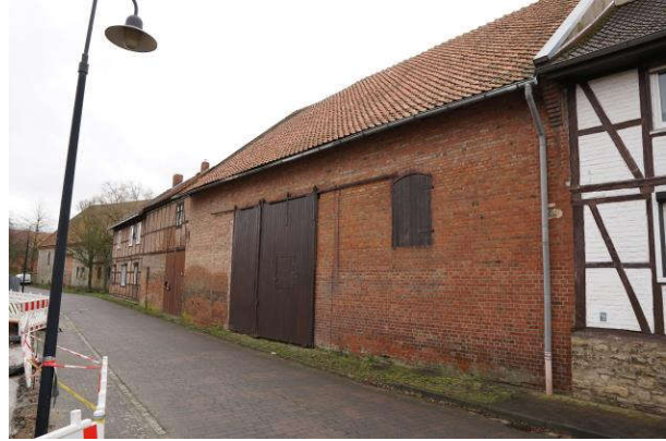
straßenseitige Ansicht der Scheune und Durchfahrt