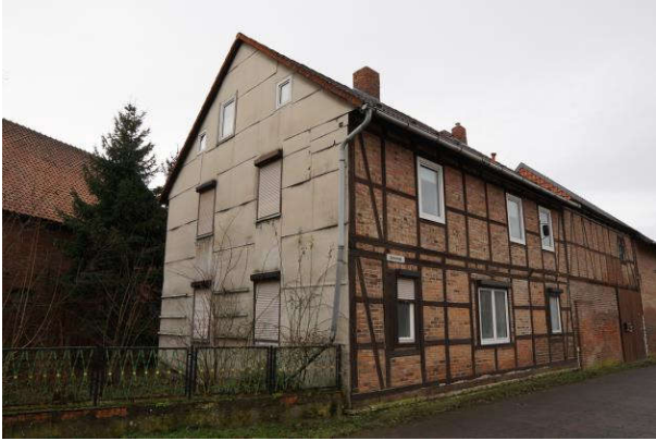
straßenseitige Ansicht des Wohnhauses