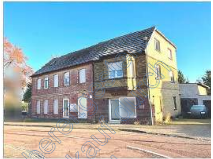
Straßenfront des Wohn-und Geschäftshauses Nr. 1/ 1.1