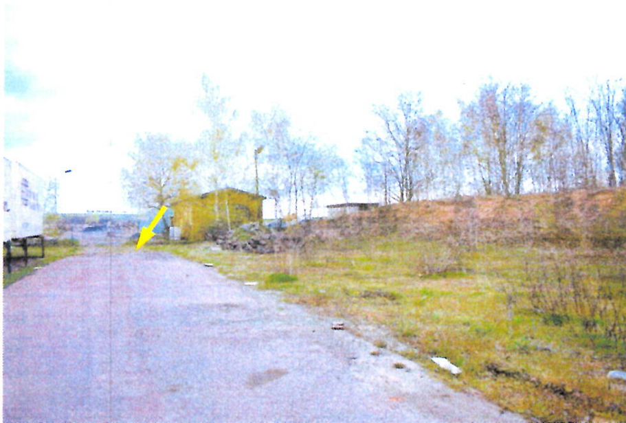
Foto 1 Westansicht des Bewertungsobjekts (BWO) 1 mit der Kennzeichnung der Lage (gelber Pfeil)