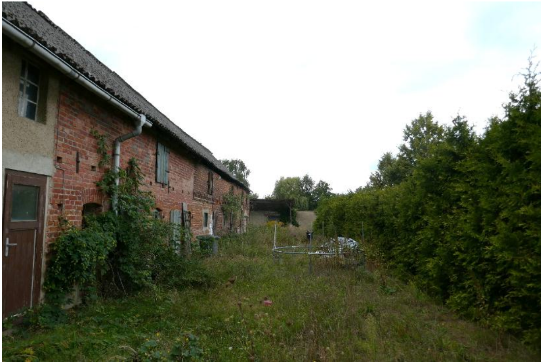
Foto 7, Gebäudeteil Wirtschaftsgebäude, Fassade Sichtmauerwerk (Hartbrandziegel), Südostansicht