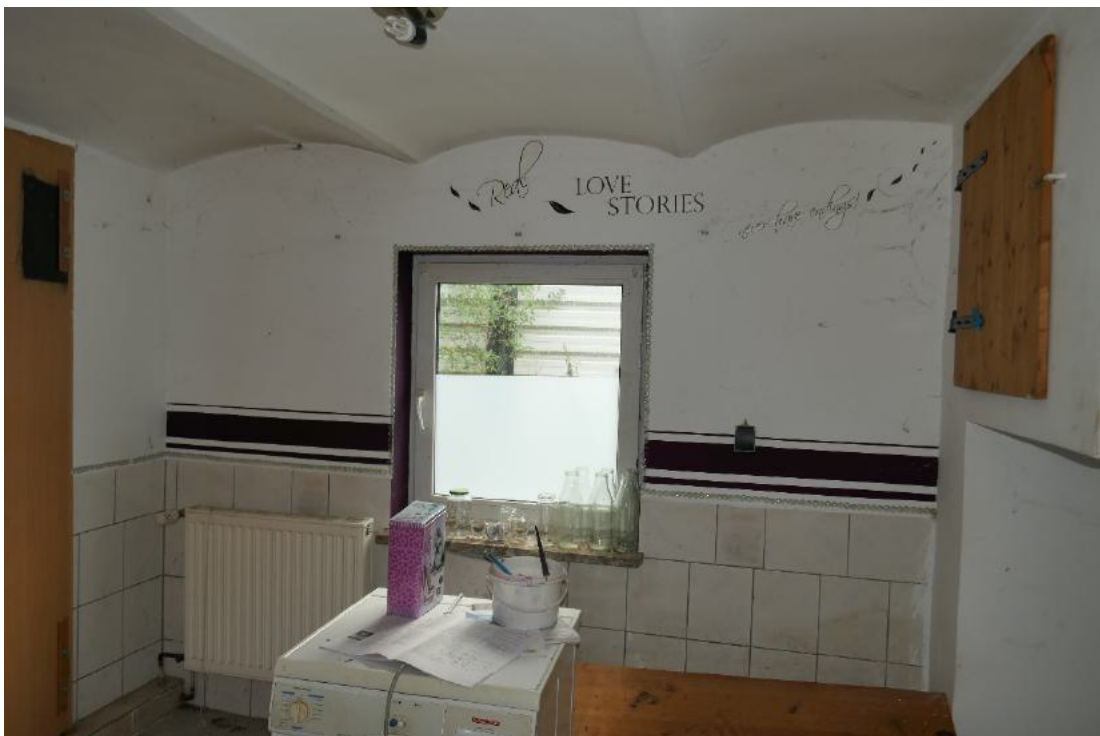
Foto 16, EG Hauswirtschaftsraum