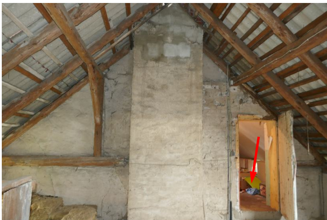
Foto 24, DG Blick vom Dachraum zum Flur im Dachgeschoss Wohngebäude (Pfeil)