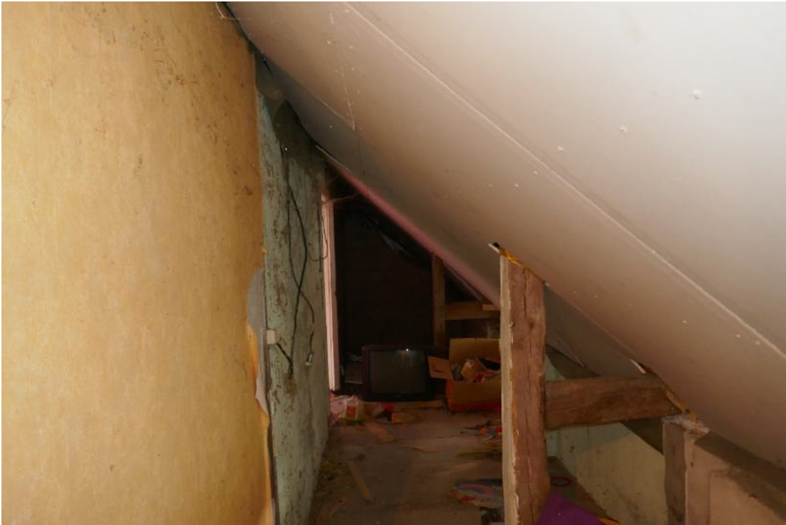
Foto 21, DG eine Abseite, Ausbau noch nicht abgeschlossen