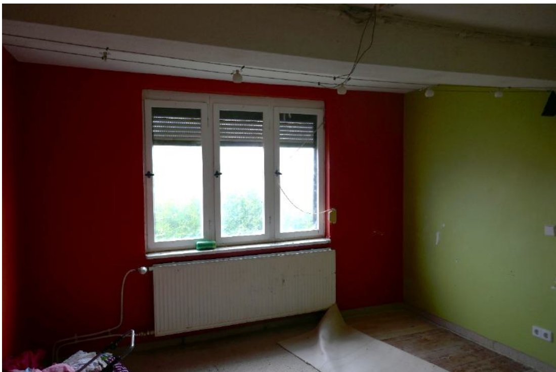
Foto 20, DG Wohnraum im Bereich des Zwerchhauses, deshalb keine Dachsträgen