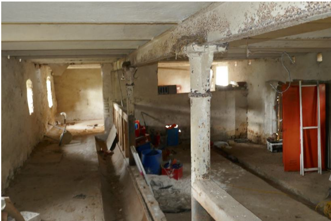
Foto 22, Erdgeschoss (EG) beispielhaft Zustand im Erdgeschoss, ehemaliger Stallbereich