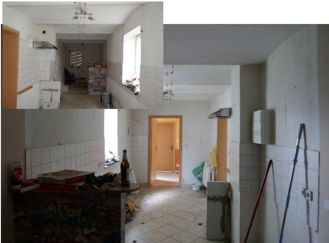
Foto 14, EG Küche, Blick zum Flur, kleines Foto Blick zum straßenseitigen Fenster (Jalousie runtergelassen)