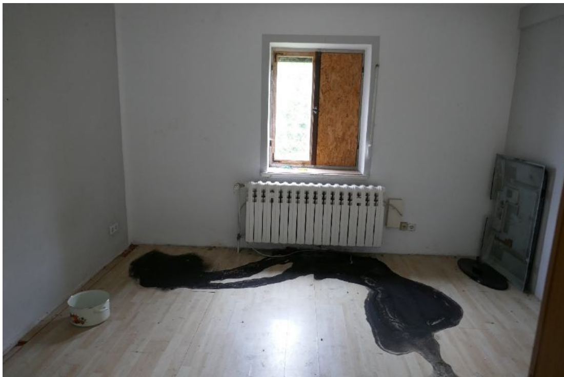
Foto 12, EG ein Wohnraum, Heizungswasser aus dem Gussradiator ausgelaufen, vermutlich Frostschaden