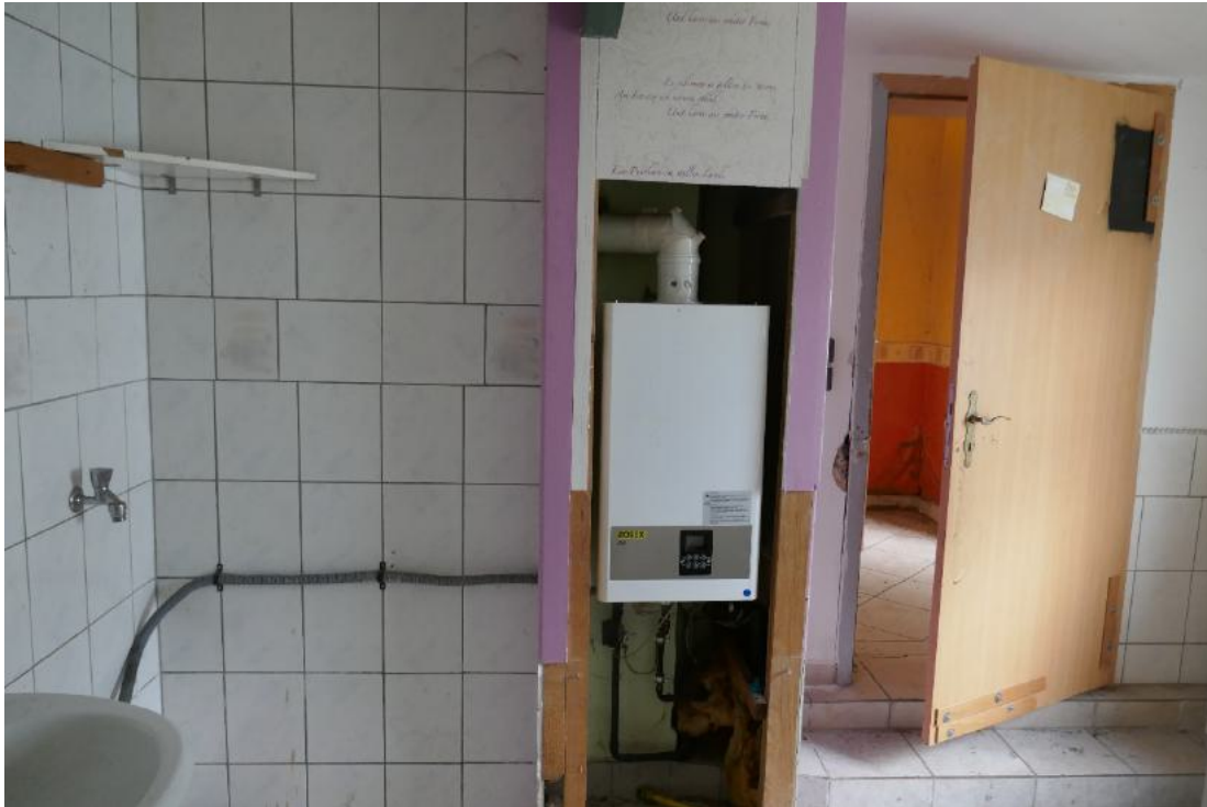
Foto 17, EG Hauswirtschaftsraum mit Gastherme der Zentralheizungsanlage