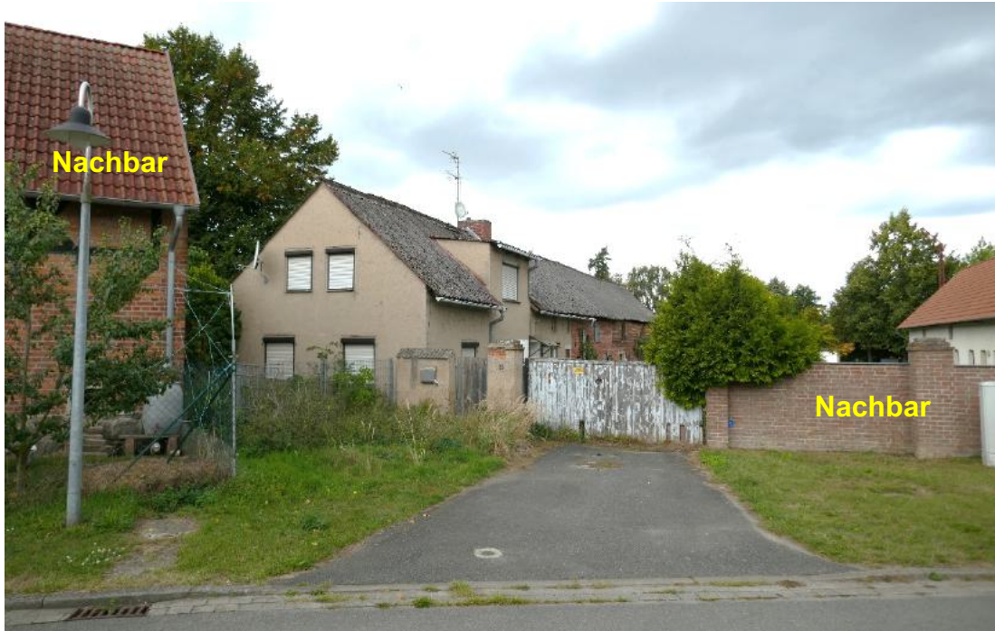
Foto 1, Blick von der Dorfstraße zum Grundstück mit Wohn-/Wirtschaftsgebäude (Geb. 1), Ostansicht