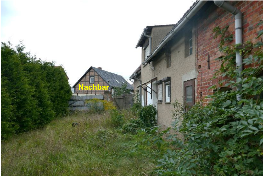
Foto 5, Gebäudeteil Wohngebäude, Fassade geputzt, im Hintergrund Zufahrt zum Grundstück mit Tor verschlossen, Nordwestansicht