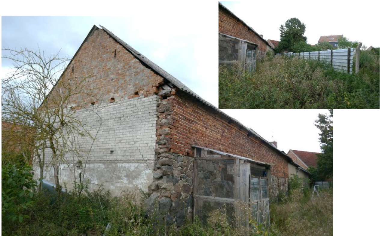
Foto 8, Gebäudeteil Wirtschaftsgebäudesüdwestliche Außenwand, kleines Foto Zaun mit Profilblechen beplankt, Nordwestansicht