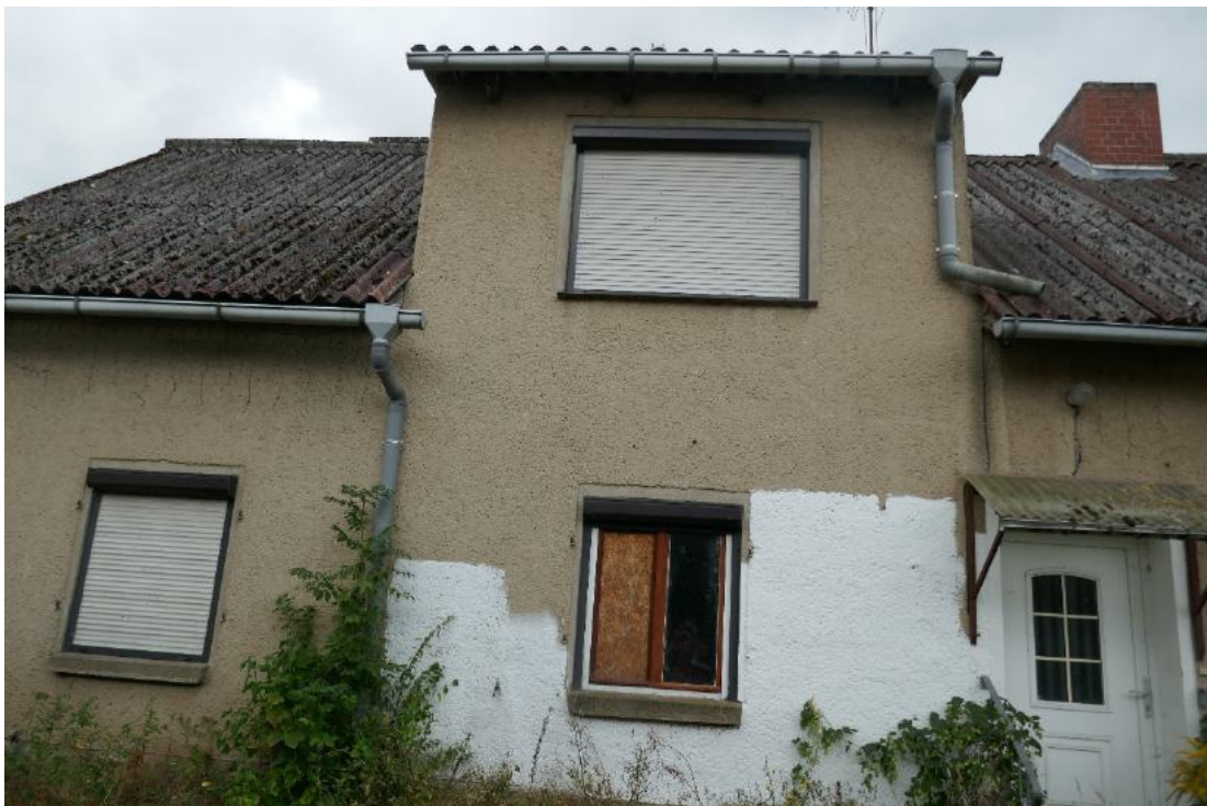
Foto 6, Gebäudeteil Wohngebäude mit großem Dachaufbau, einem Zwerchhaus, und Hauseingangstür, Nordostansicht