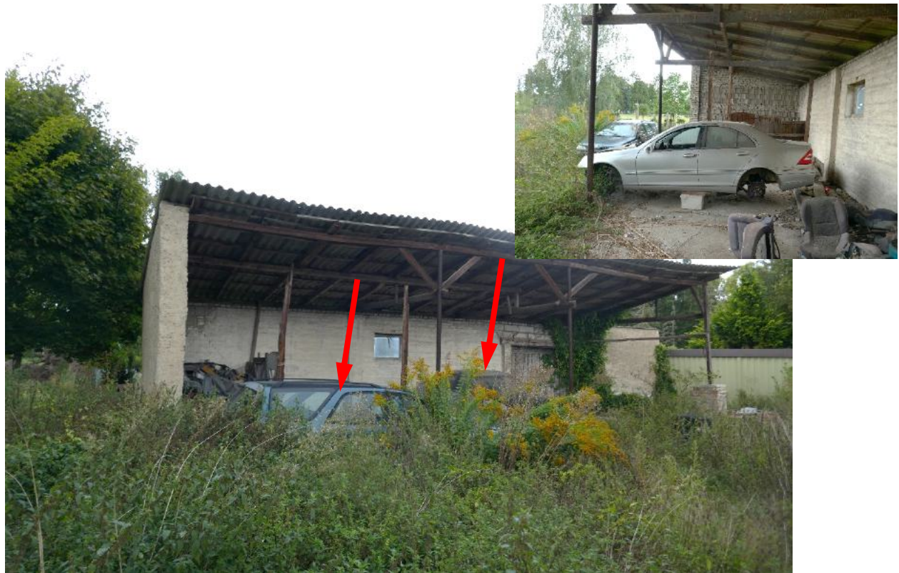
Foto 10, Unterstand (Geb. 2), schlechter baulicher Zustand, kein Zeit-/Marktwert, Pfeile weisen zu fahruntüchtigen Pkw, Südostansicht