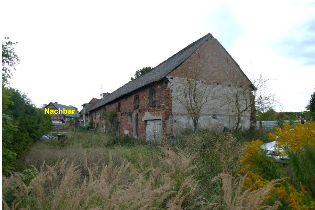
Foto 4, Blick vom Grundstück zum Wohn-/Wirtschaftsgebäude (Geb. 1), im Vordergrund Gebäudeteil Wirtschaftsgebäude, Nordwestansicht