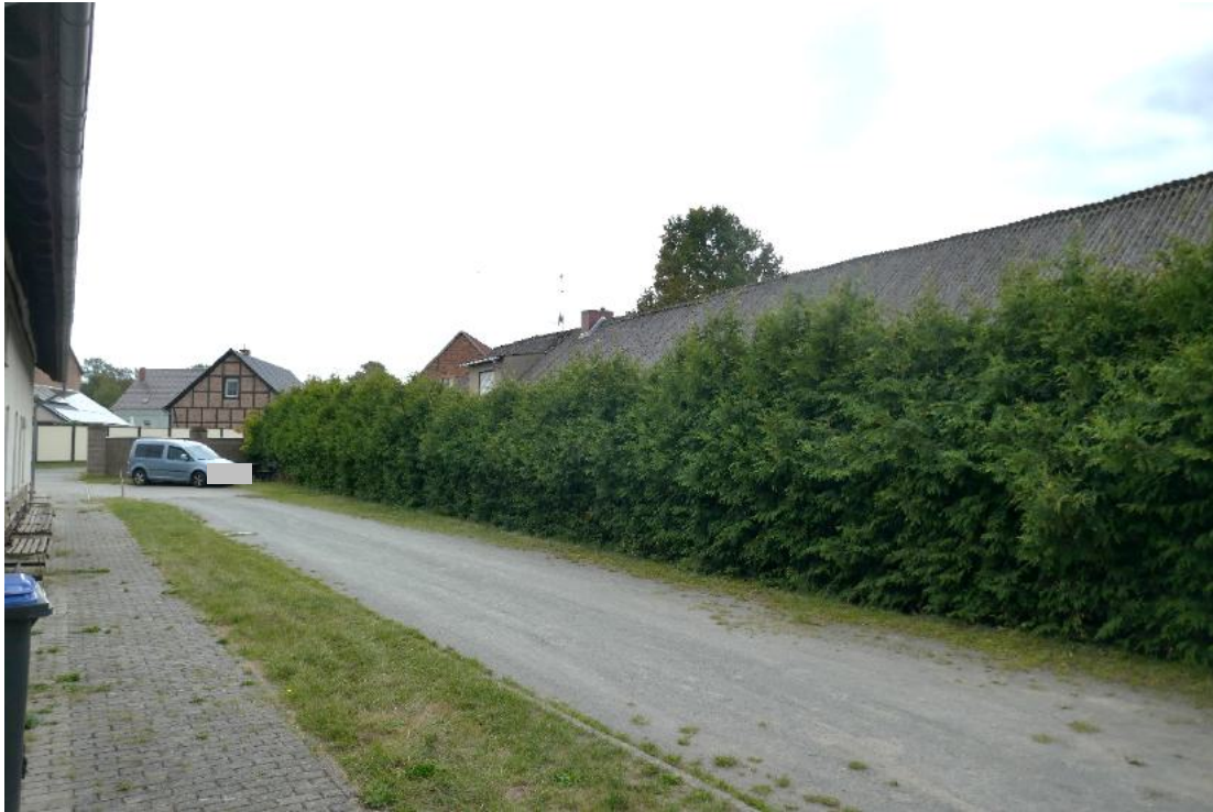
Foto 3, Blick vom Nachbargrundstück, Stützpunkt Freiwillige Feuerwehr Roxförde, zum Grundstück hinter der hohen Koniferenhecke, Nordwestansicht