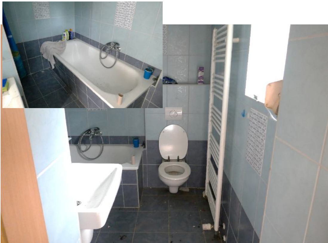
Foto 15, EG Bad/WC, kleines Foto eingebaute, eingeflieste Wanne