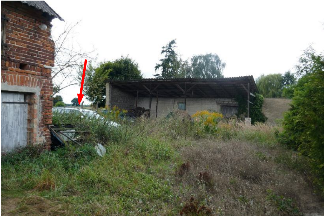
Foto 9, Blick zum Unterstand (Geb. 2), Pfeil weist zu einem fahruntüchtigen Pkw, Südostansicht