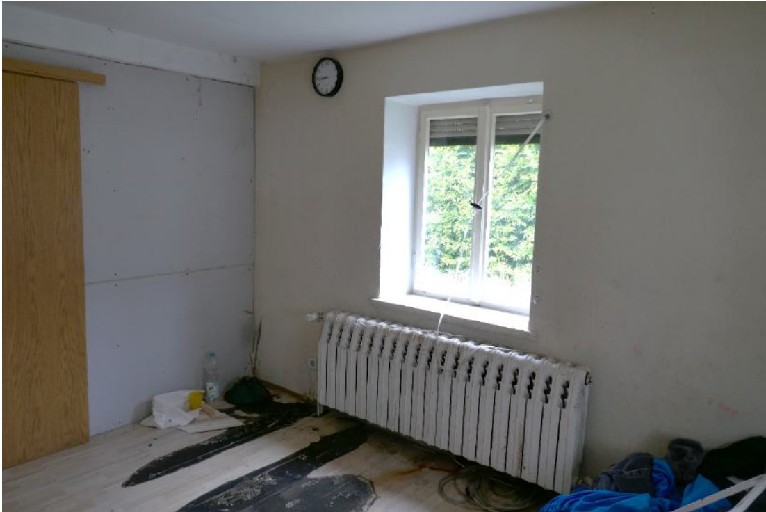
Foto 13, EG weiterer Wohnraum, auch hier Heizungswasser aus dem Gussradiator ausgelaufen, vermutlich Frostschaden