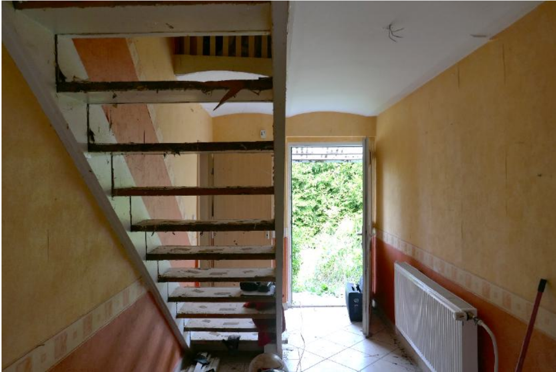
Foto 11, Erdgeschoss (EG) Flur Blick zur Haustür und Treppe zum ausgebauten Dachgeschoss