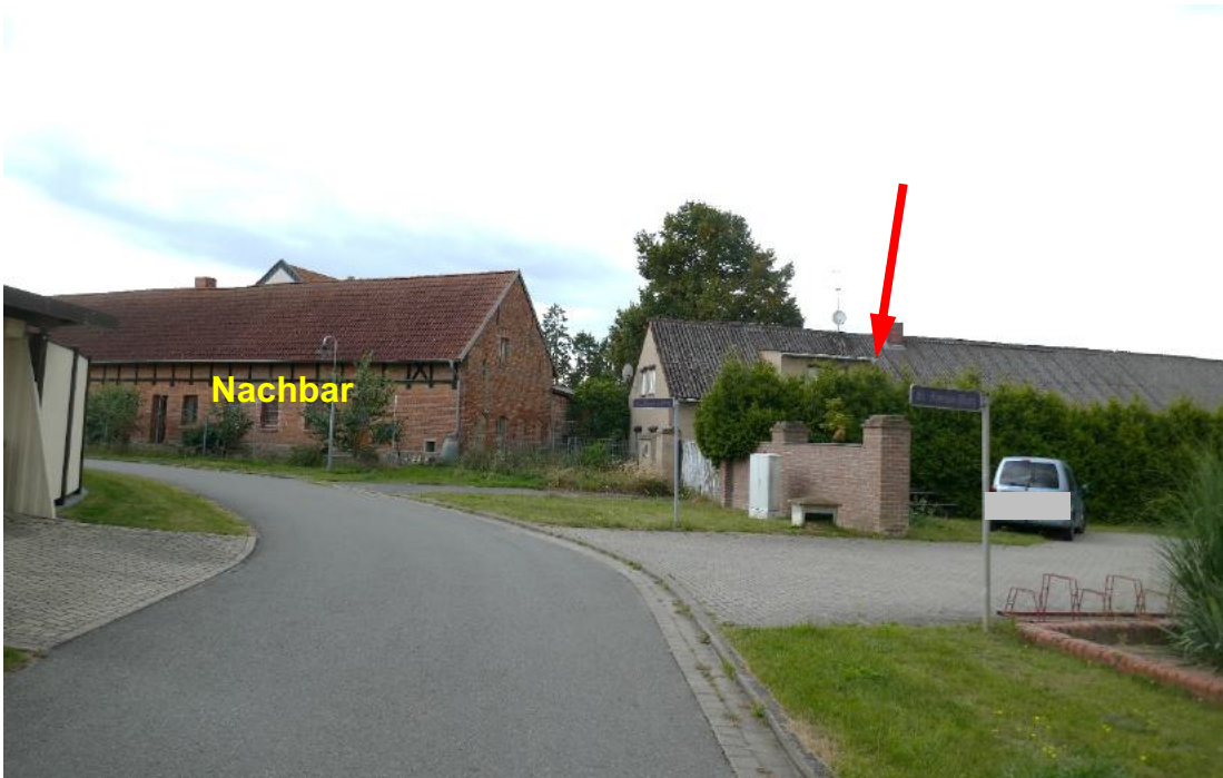
Foto 2, Dorfstraße, Blick nach Westen, Pfeil weist zum Grundstück mit Wohn-/Wirtschaftsgebäude (Geb. 1), Nordostansicht