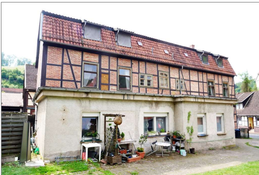
Apartmenthaus - Nordansicht