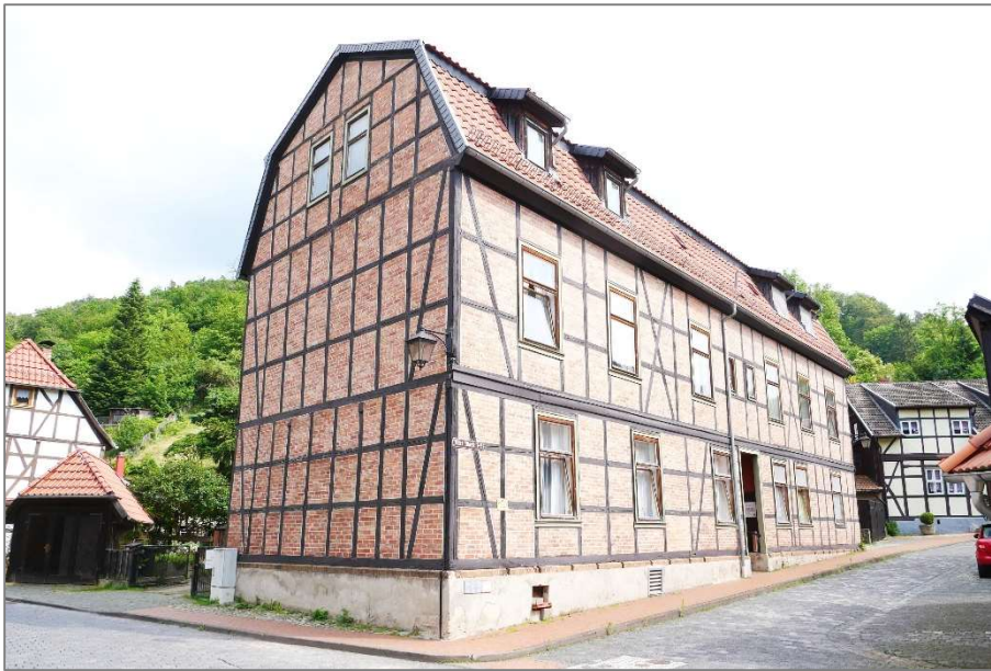
Apartmenthaus - Südwestansicht