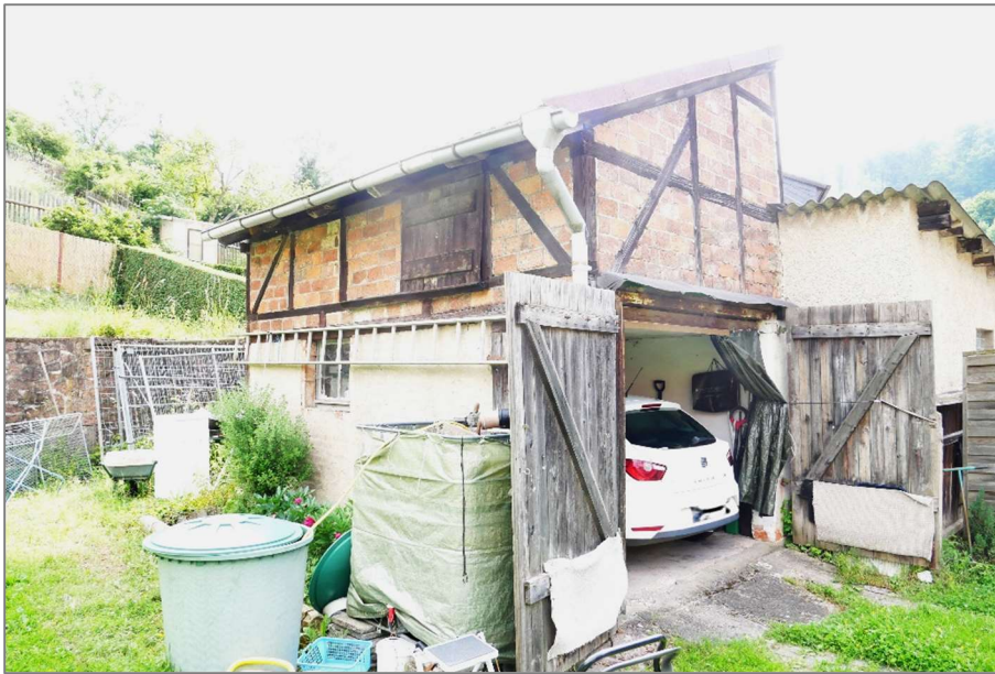
Nebengebäude - Nordwestansicht