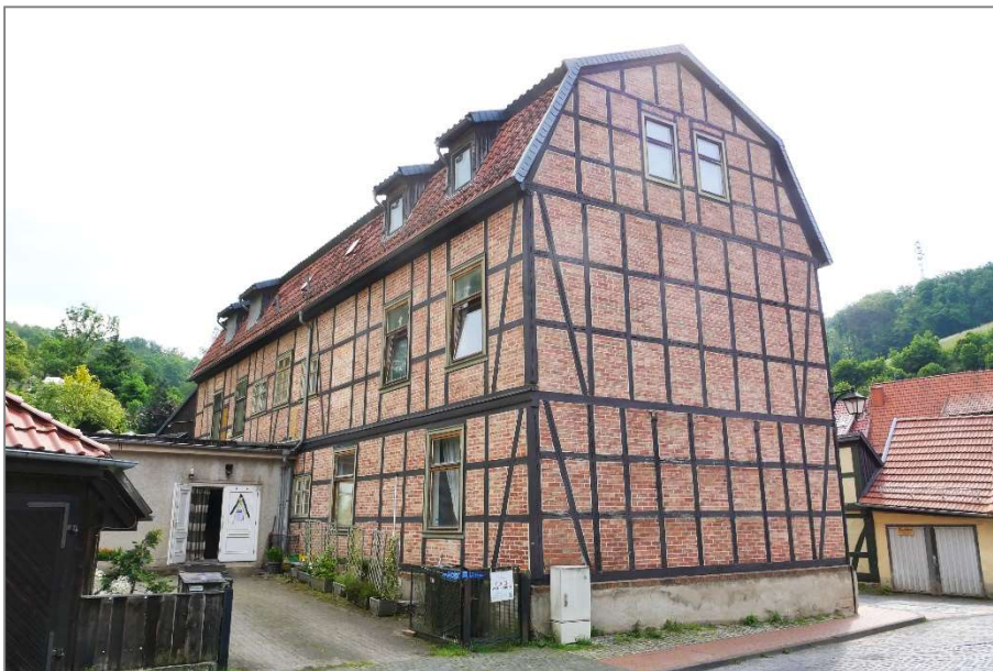
Apartmenthaus - Westansicht