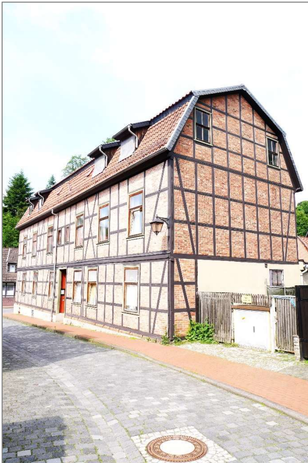
Apartmenthaus - Ostansicht