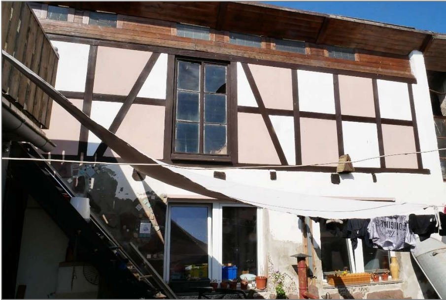
Werkstatt - Ostansicht