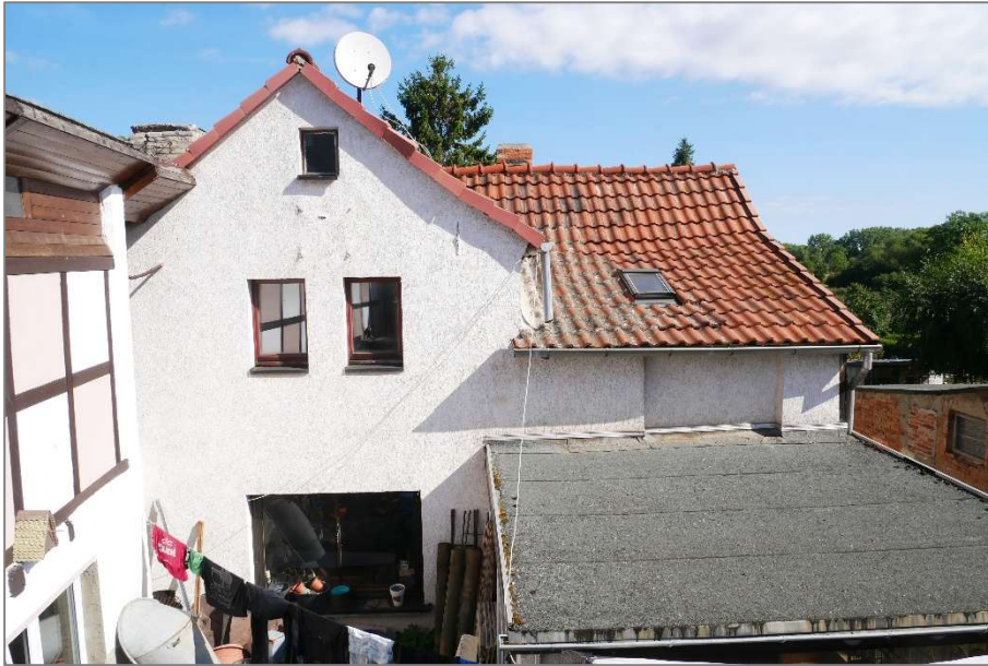
Wohnhaus - Südansicht