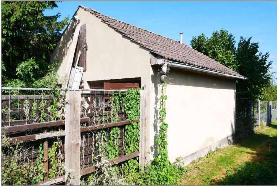
Garage - Südostansicht