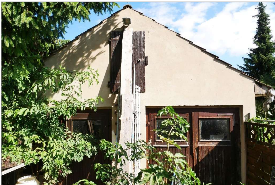
Garage - Südensicht