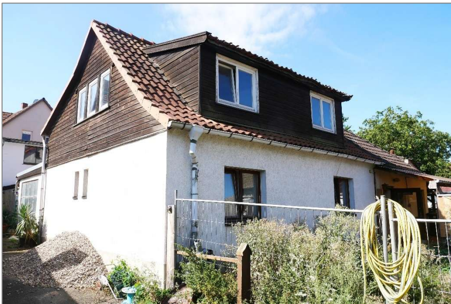
Wohnhaus - Nordostansicht